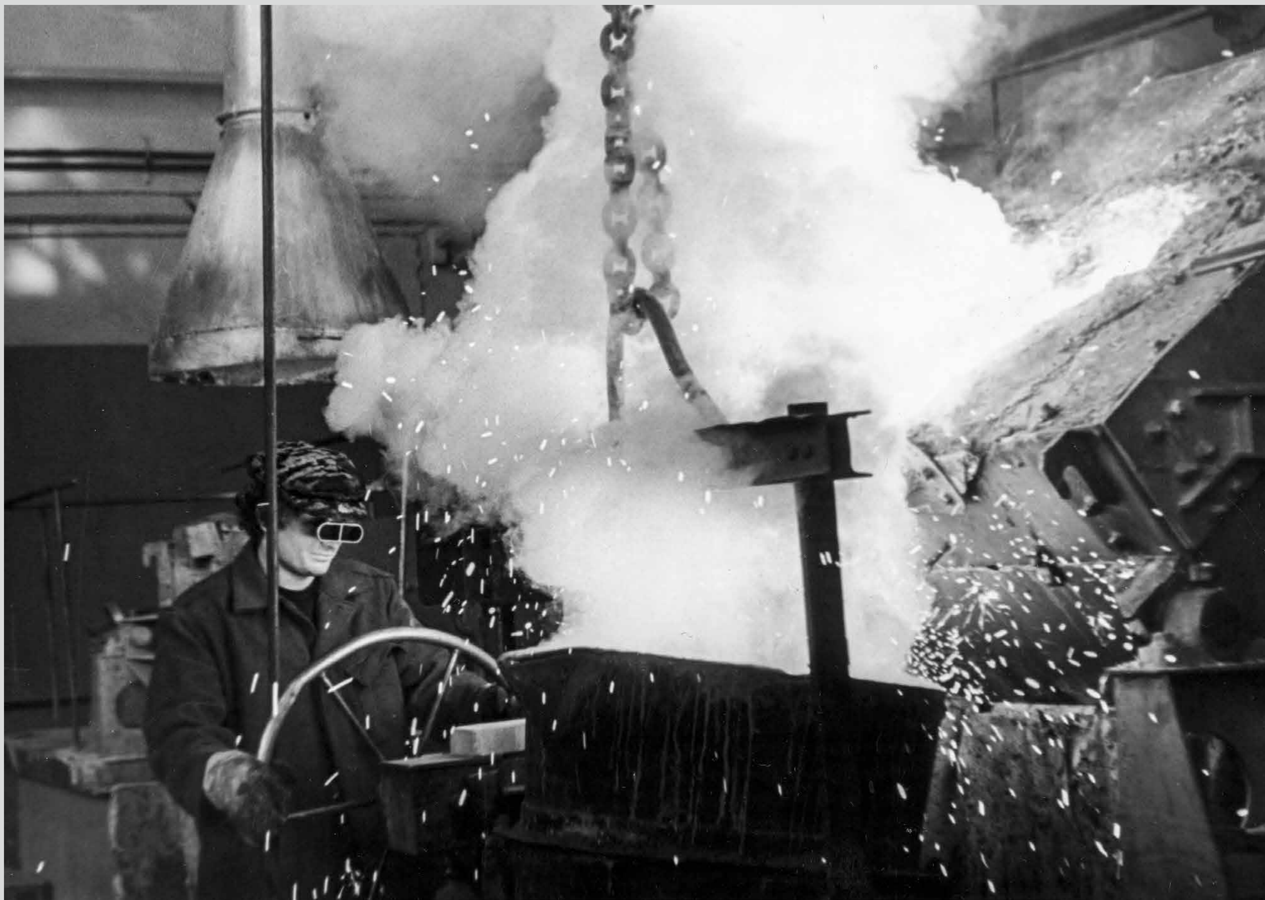
В цехе предприятия. Конец 1970-х годов