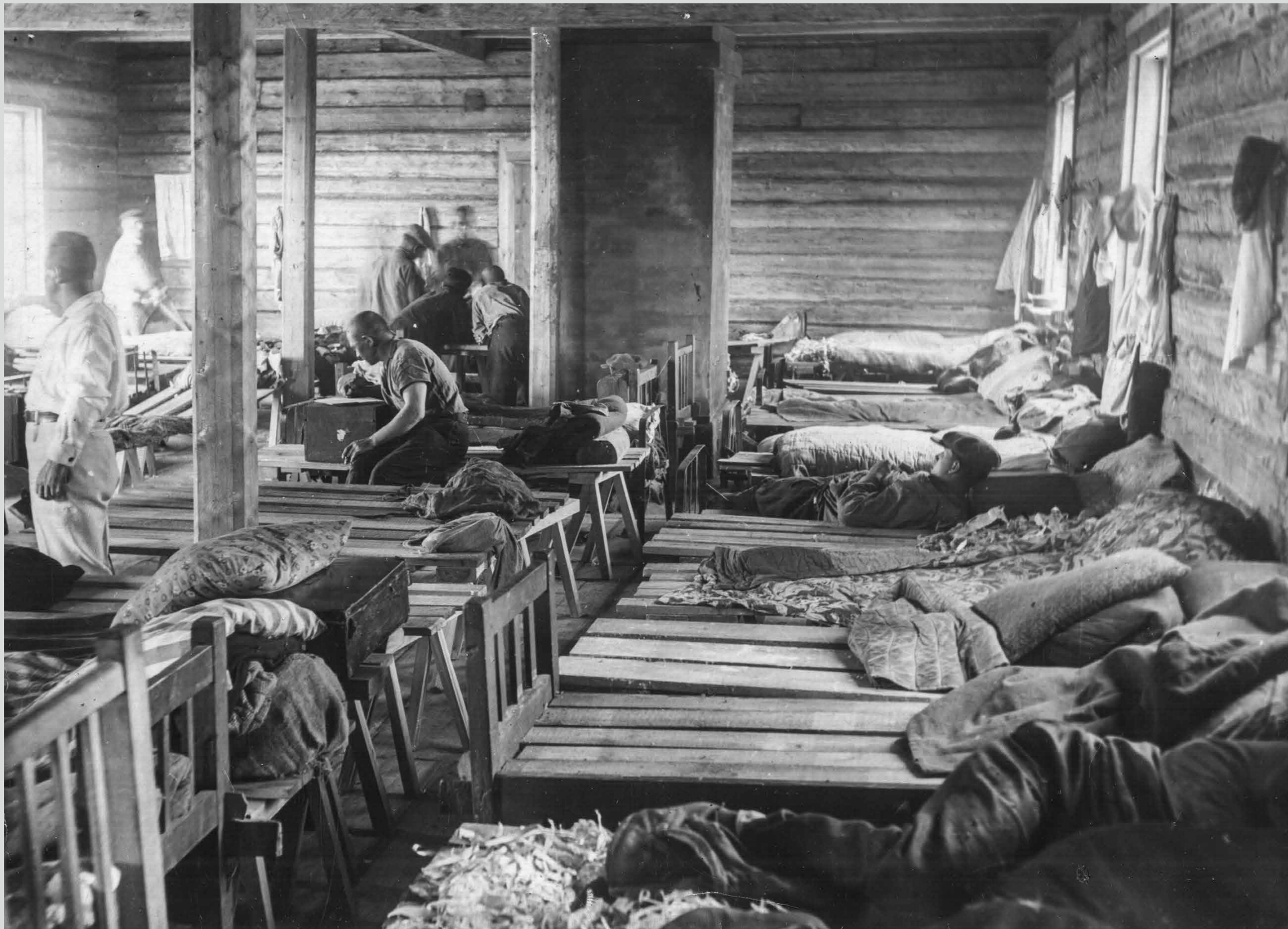
В одном из первых барачков строительства. 1936 г.