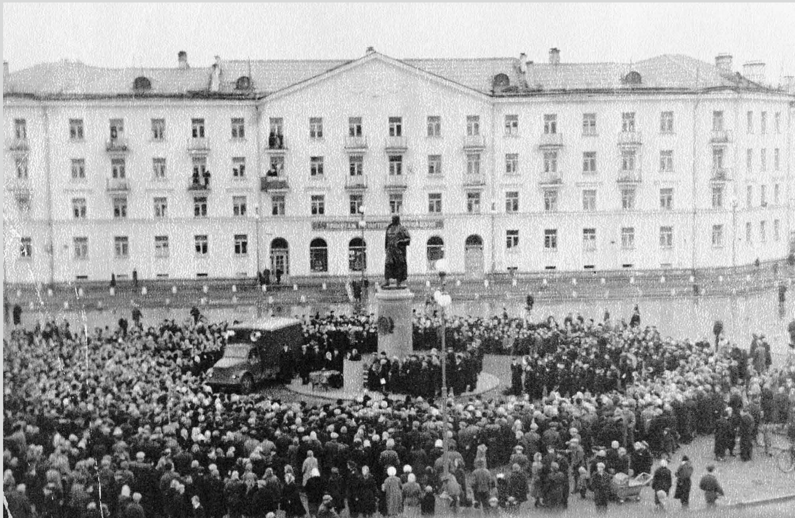
Открытие памятника М.В.Ломоносову. 1 ноября 1958 года