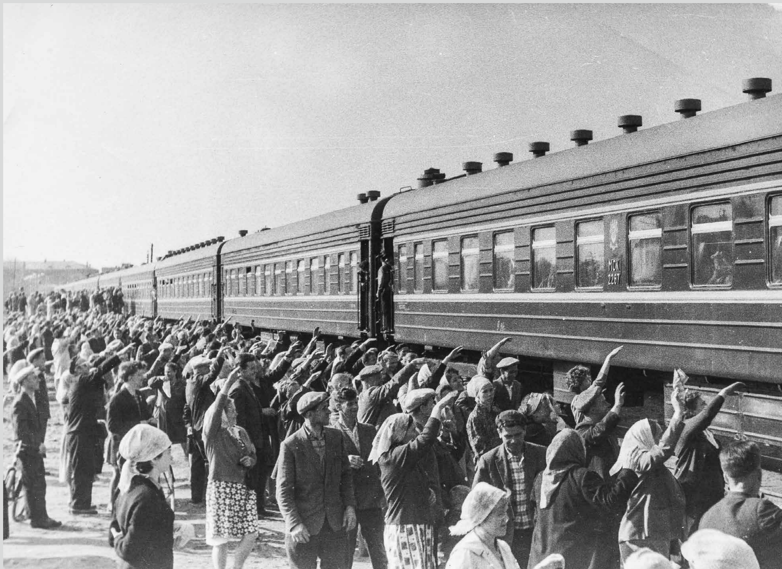
Проводы детей в пионерский лагерь. Железнодорожный вокзал г.Северодвинска. 1960-е годы