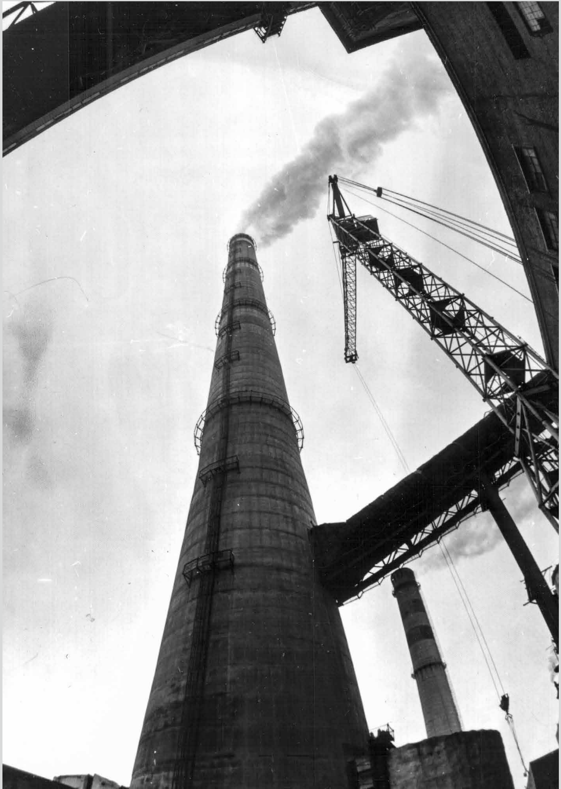
Новая двухсотметровая труба на ТЭЦ-1. 1985 год