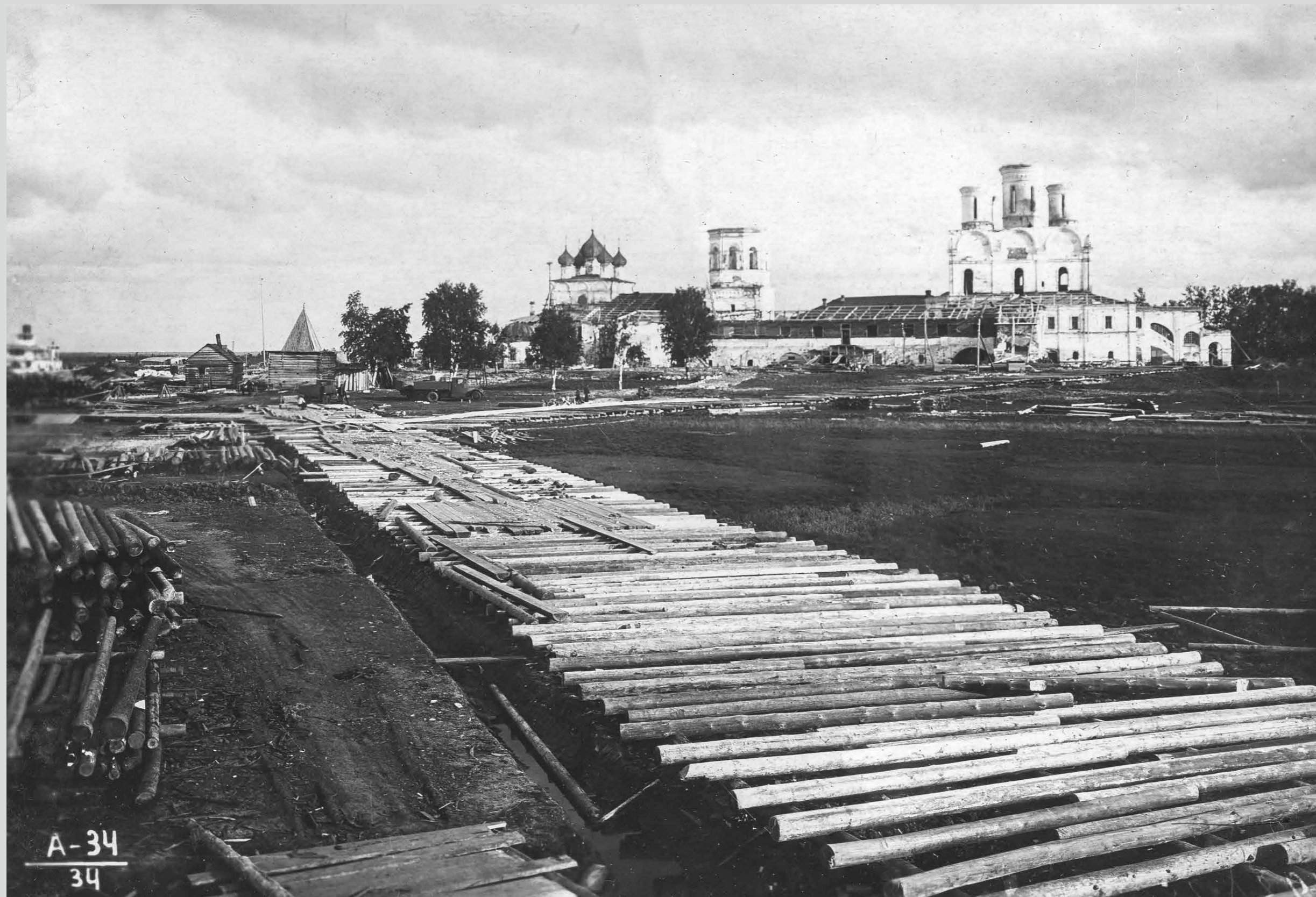
Настилают первую дорогу. 1936 год