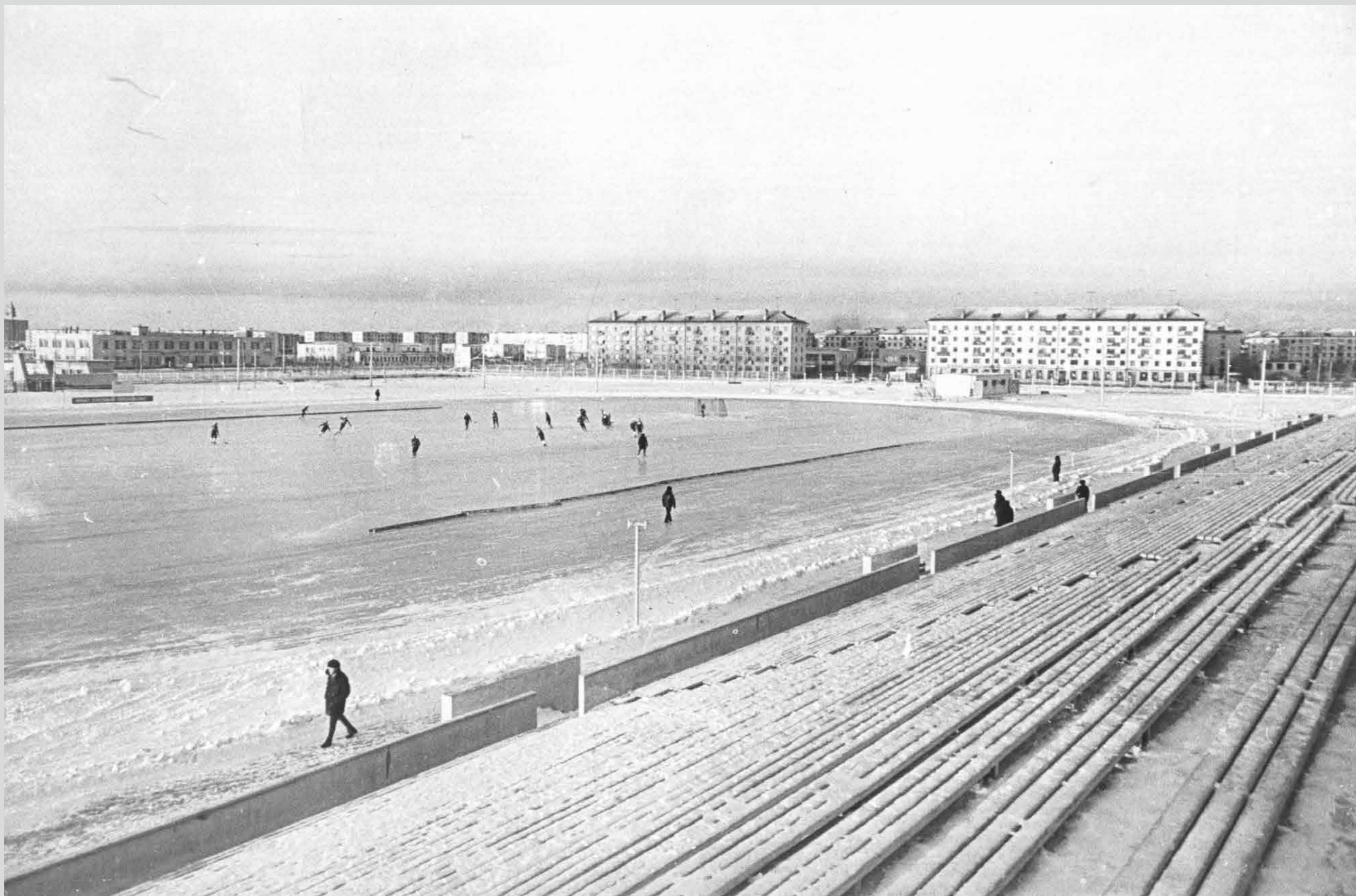
Стадион «Север». 1976 год