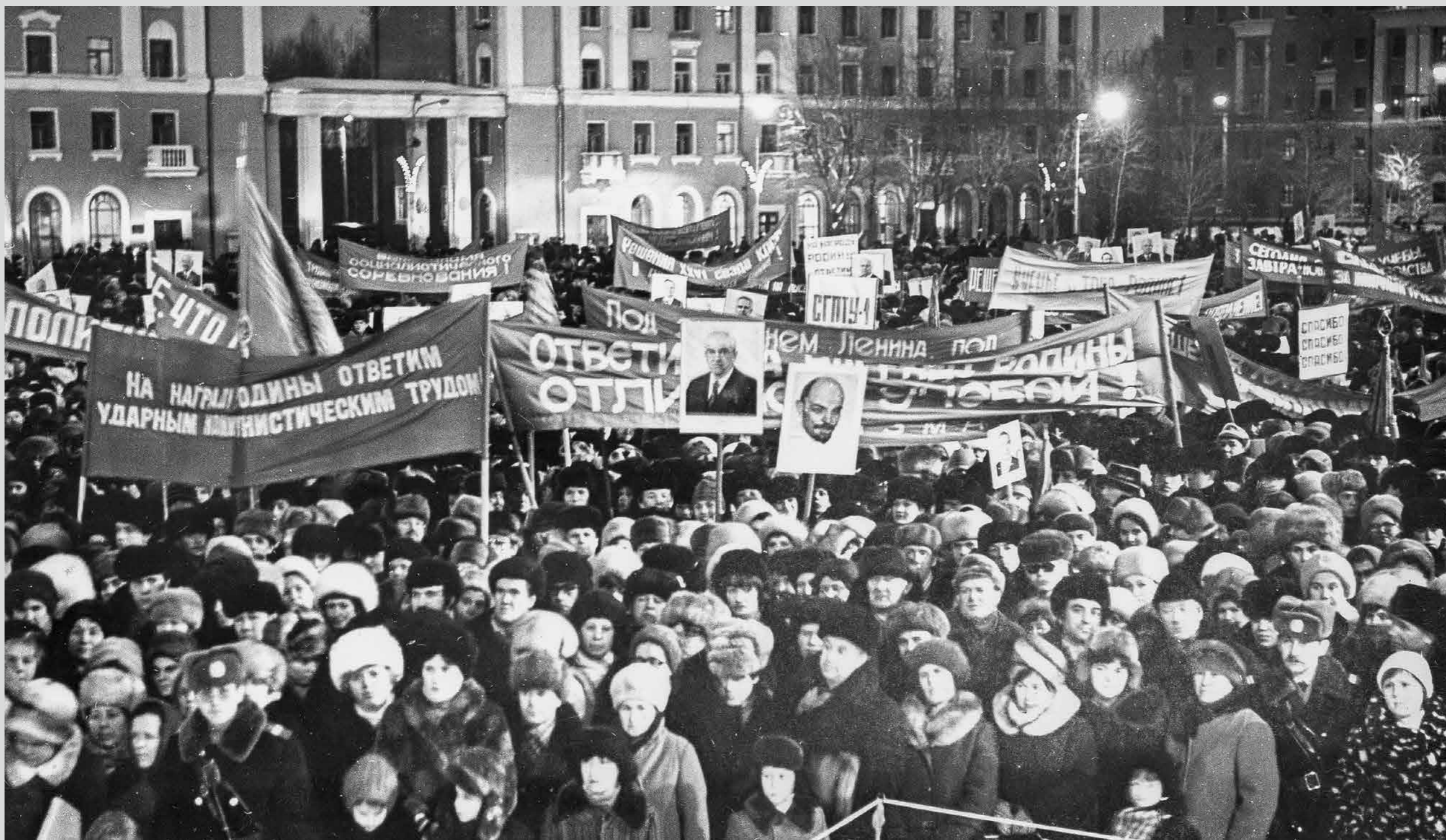
Митинг, посвященный награждению Северодвинска орденом Ленина. 1983 год