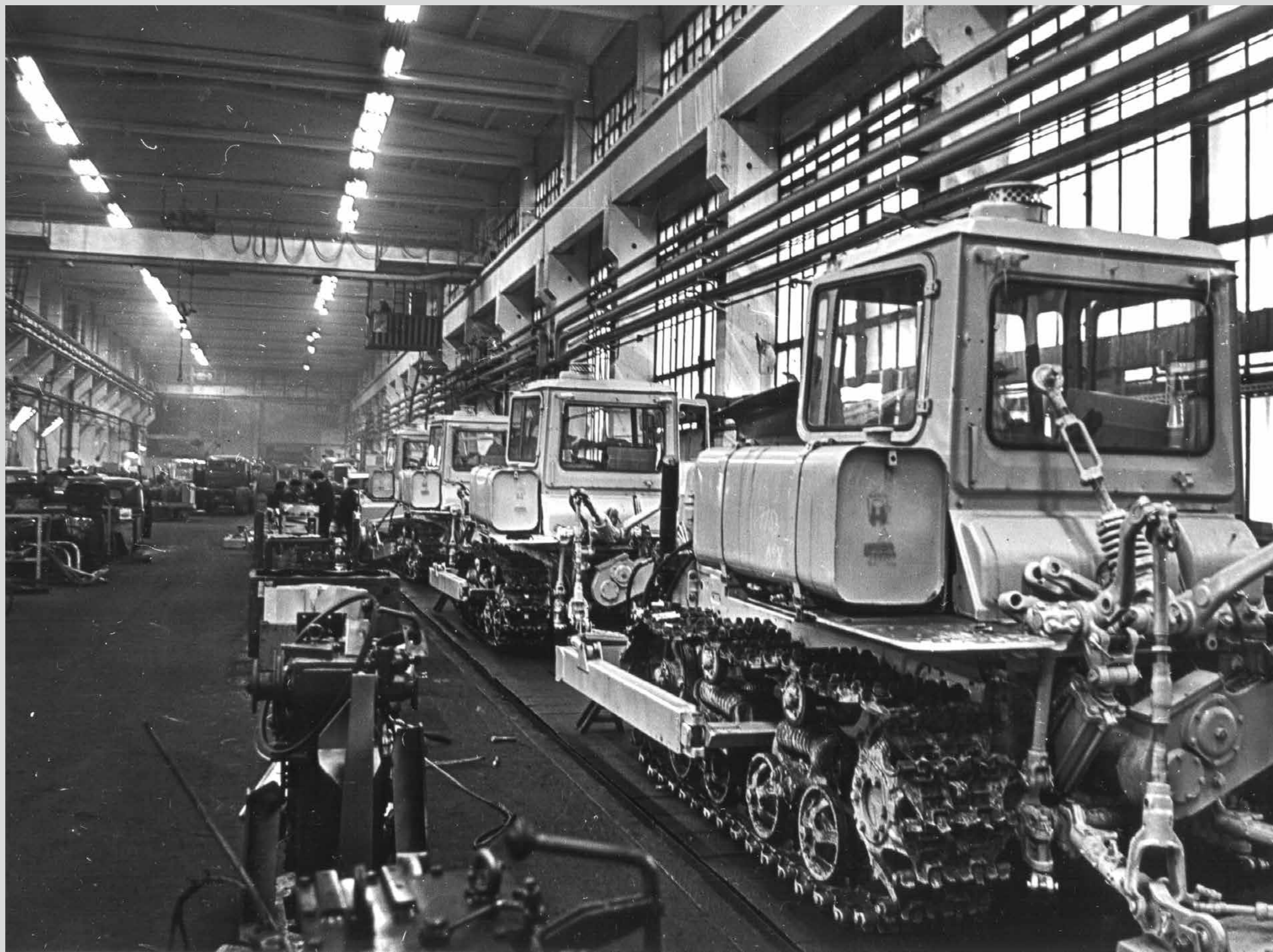
Сборочный конвейер Севдормаша. 1982 год