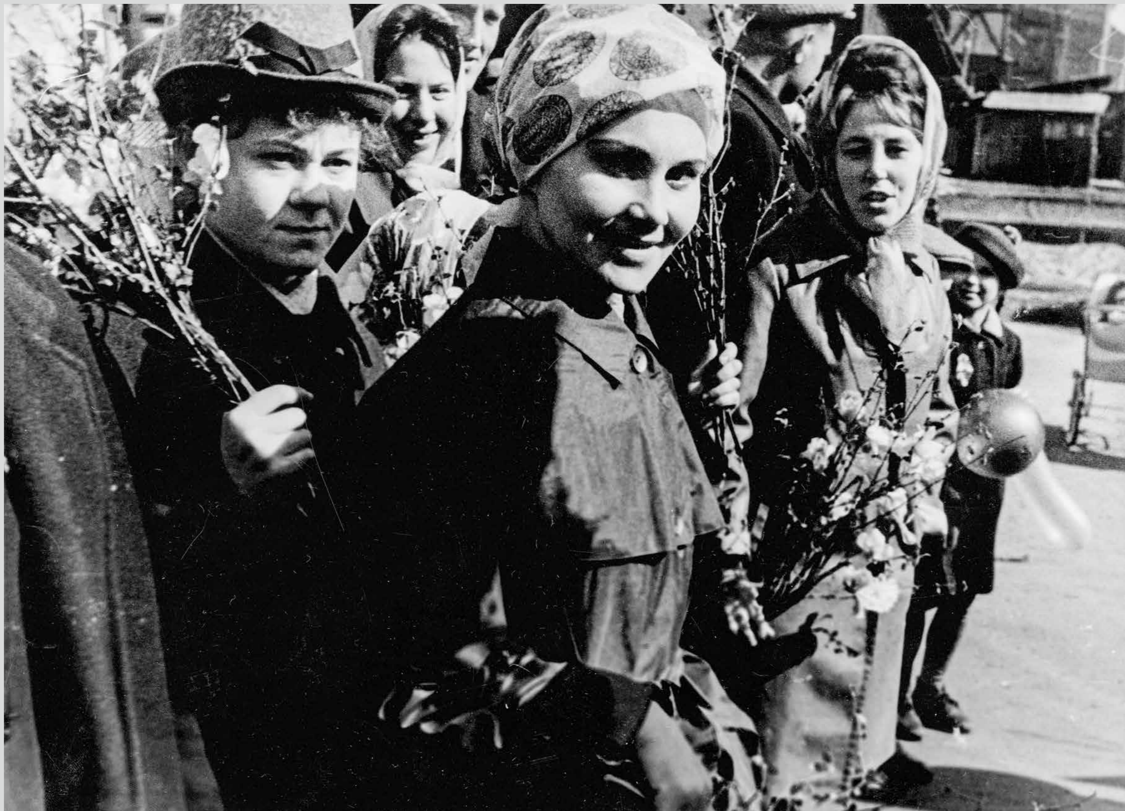
Работницы КСКМ в праздничной колонне демонстрантов. 1 мая 1966 года