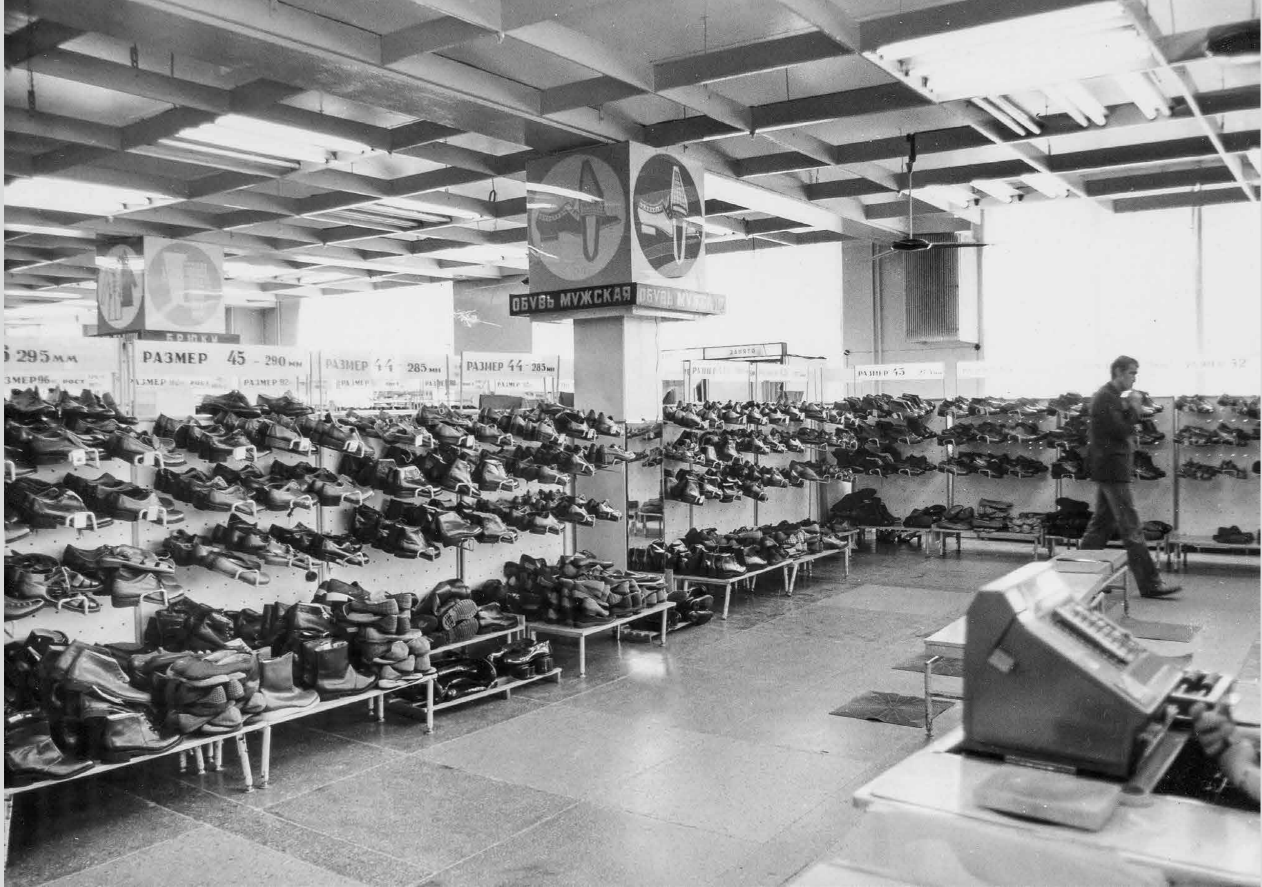
В магазине «Радуга». Начало 1980-х годов