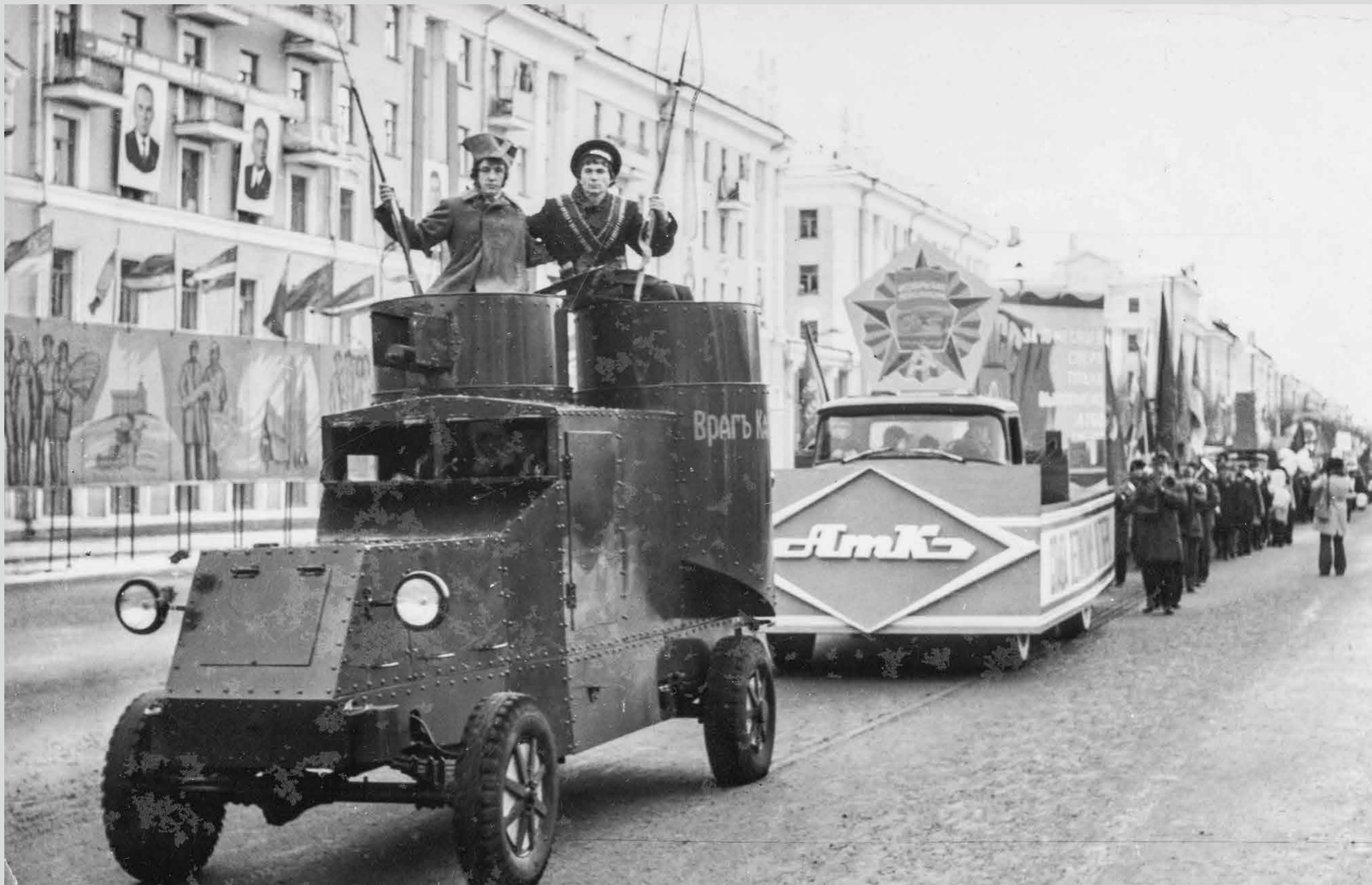
Колонна автотранспортной конторы на демонстрации. 7 ноября 1975 года