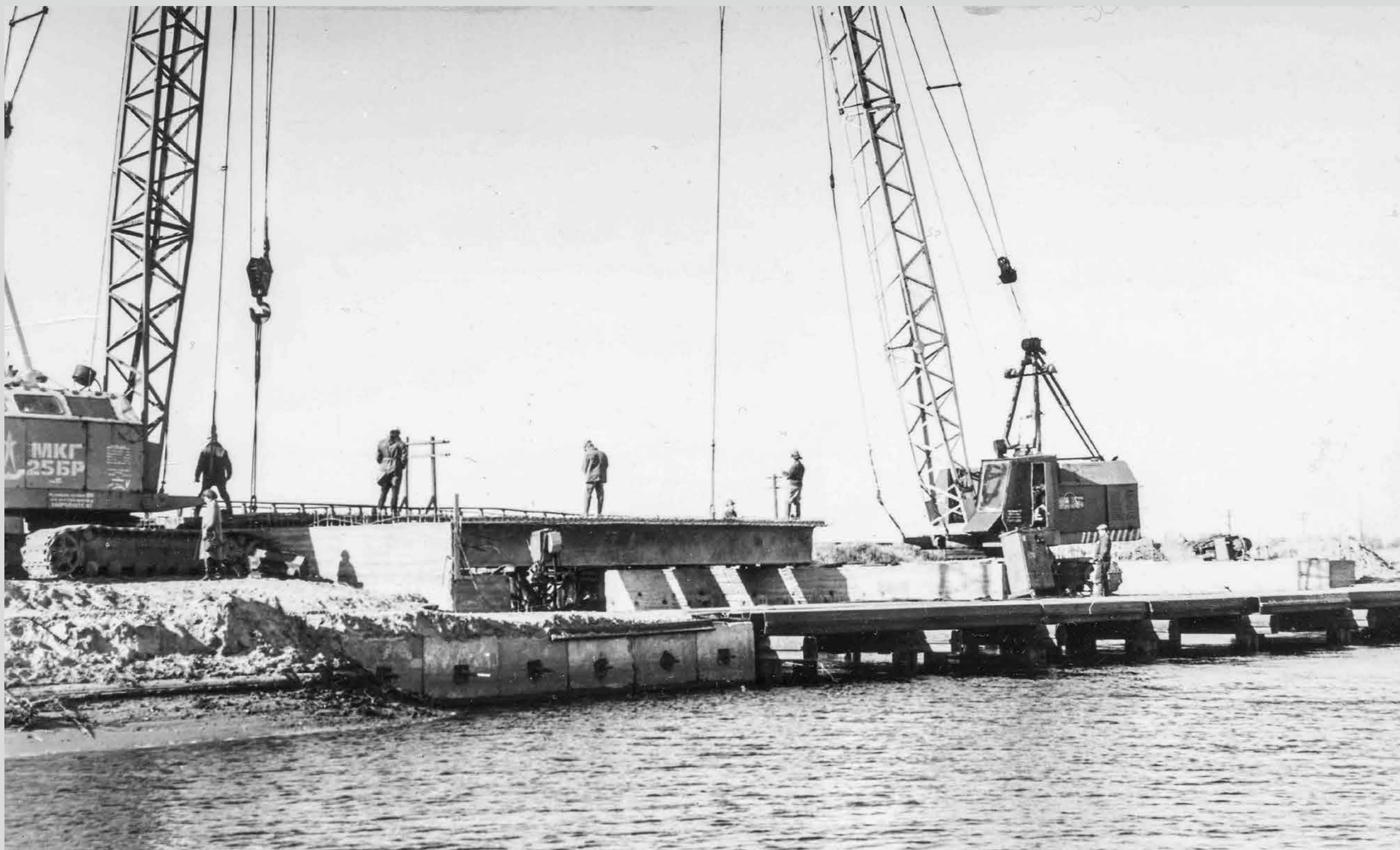
Идет строительство моста через р. Ширшима. 1983 год