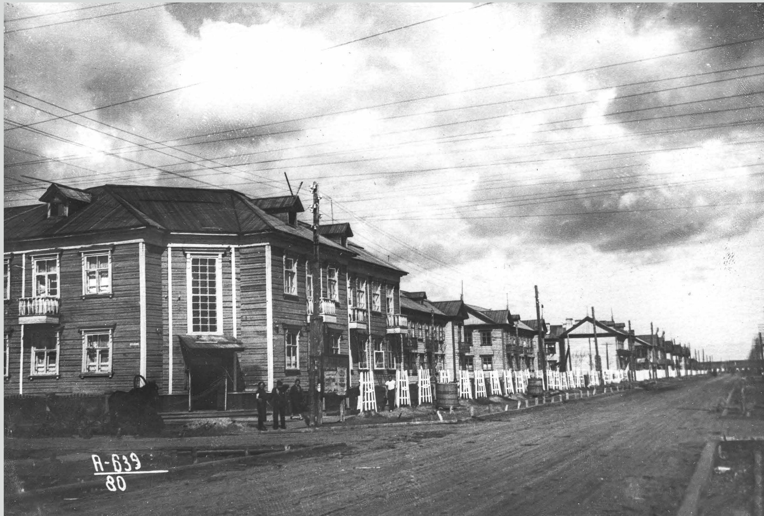
Беломорский проспект. Озеленение улиц поселка. 2 июля 1938 года