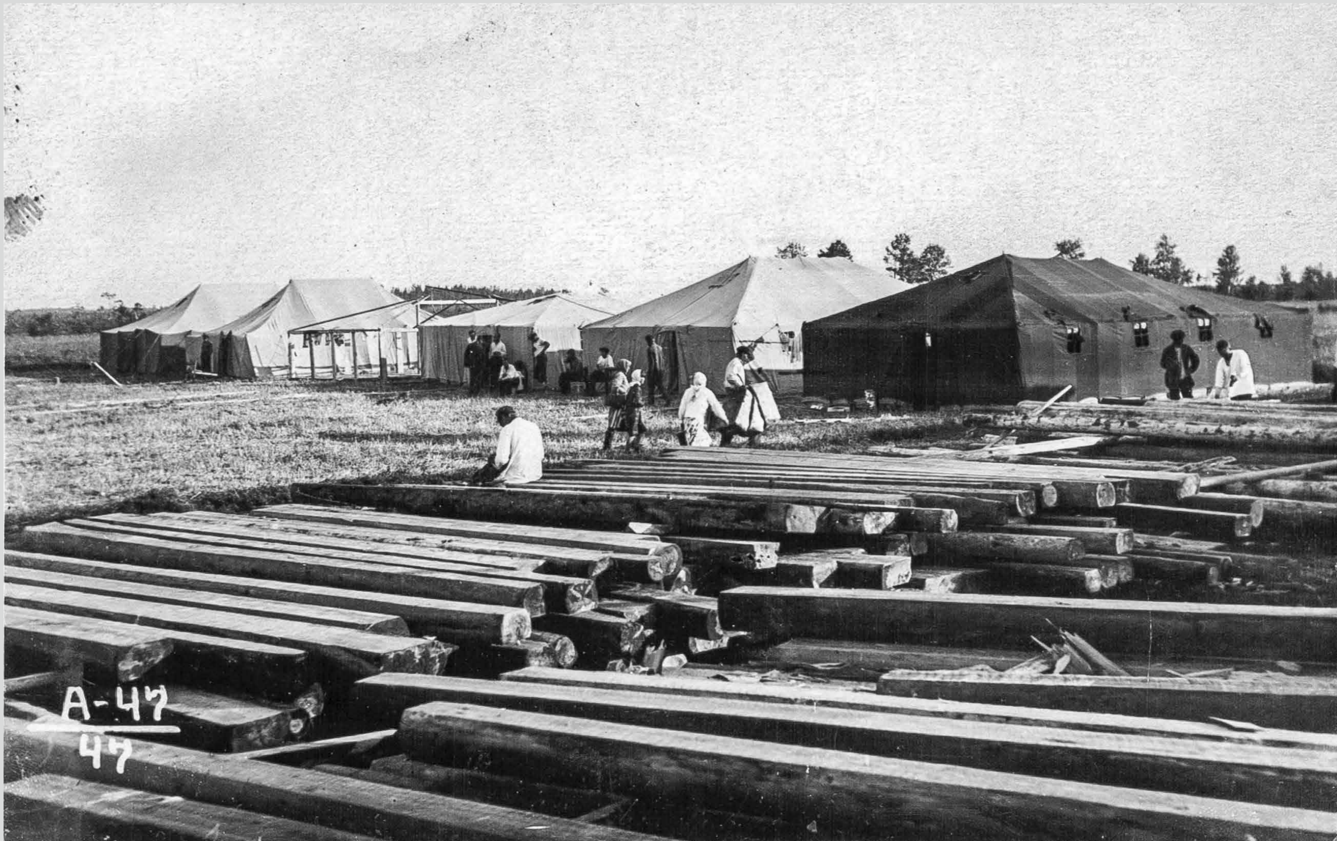
Палатки первостроителей. Лето 1936 года