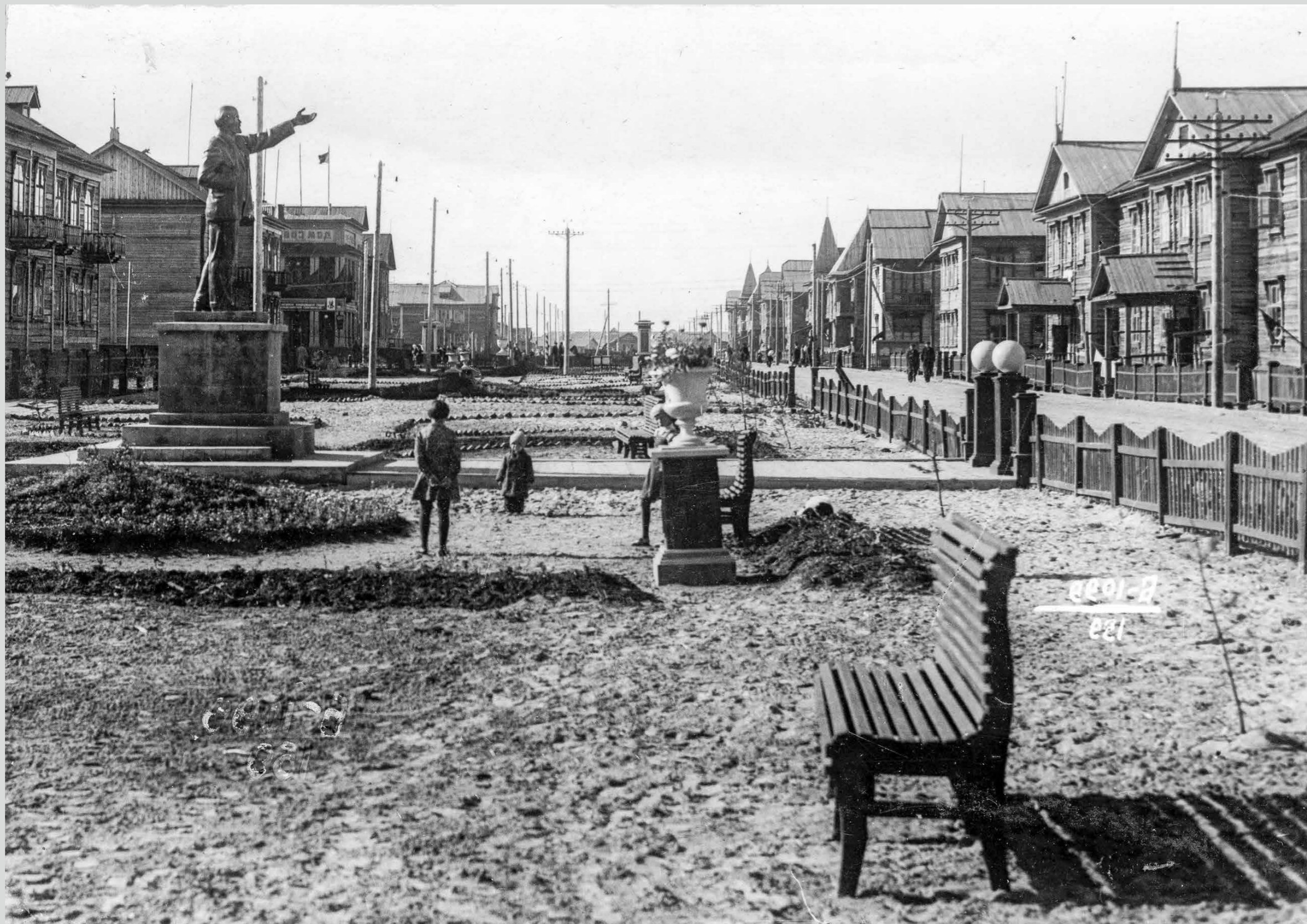
Бульвар по ул. Советской. 1939 год