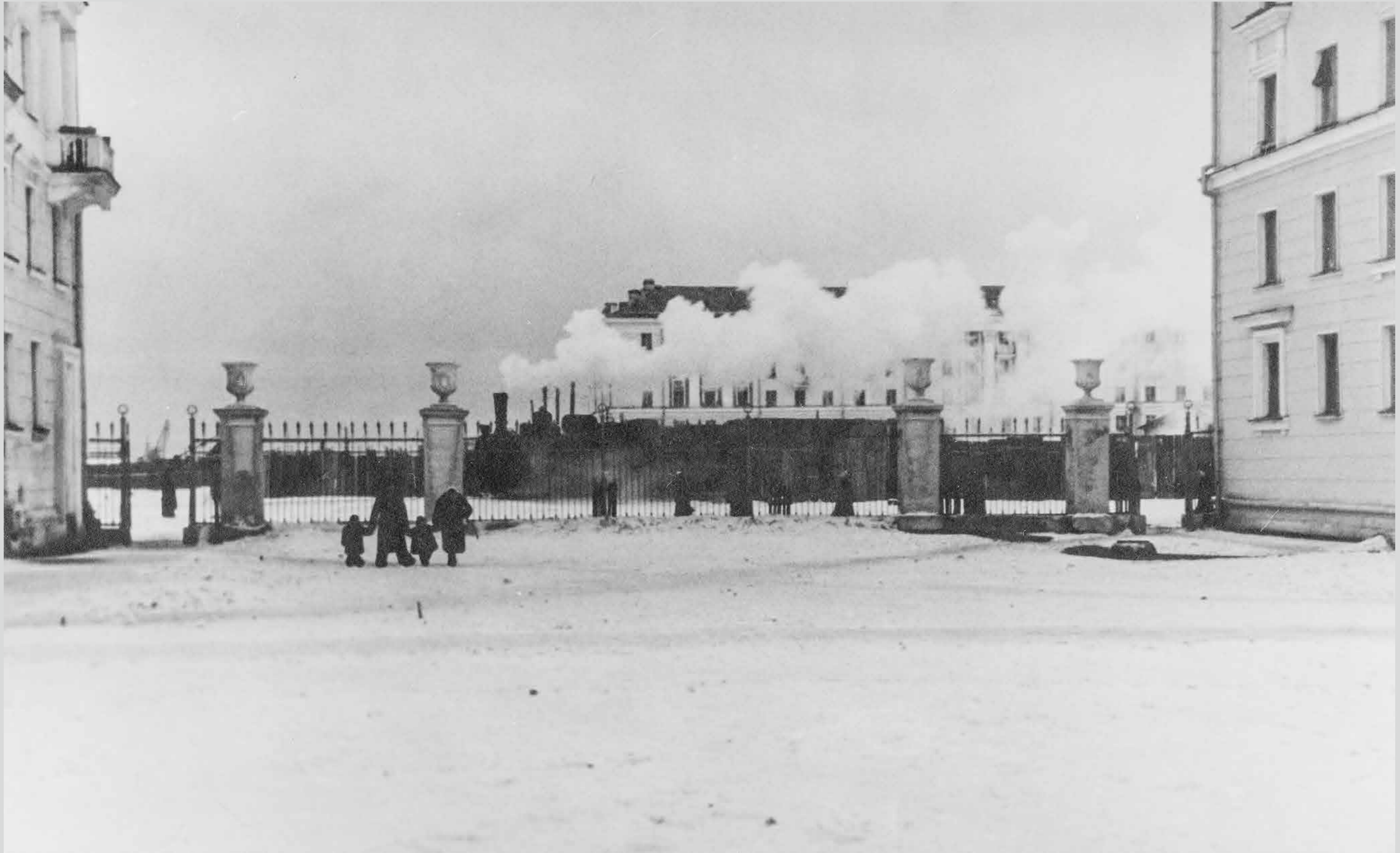
Вид между домами на улице (ныне ул.Плюснина). Конец 1950-х годов