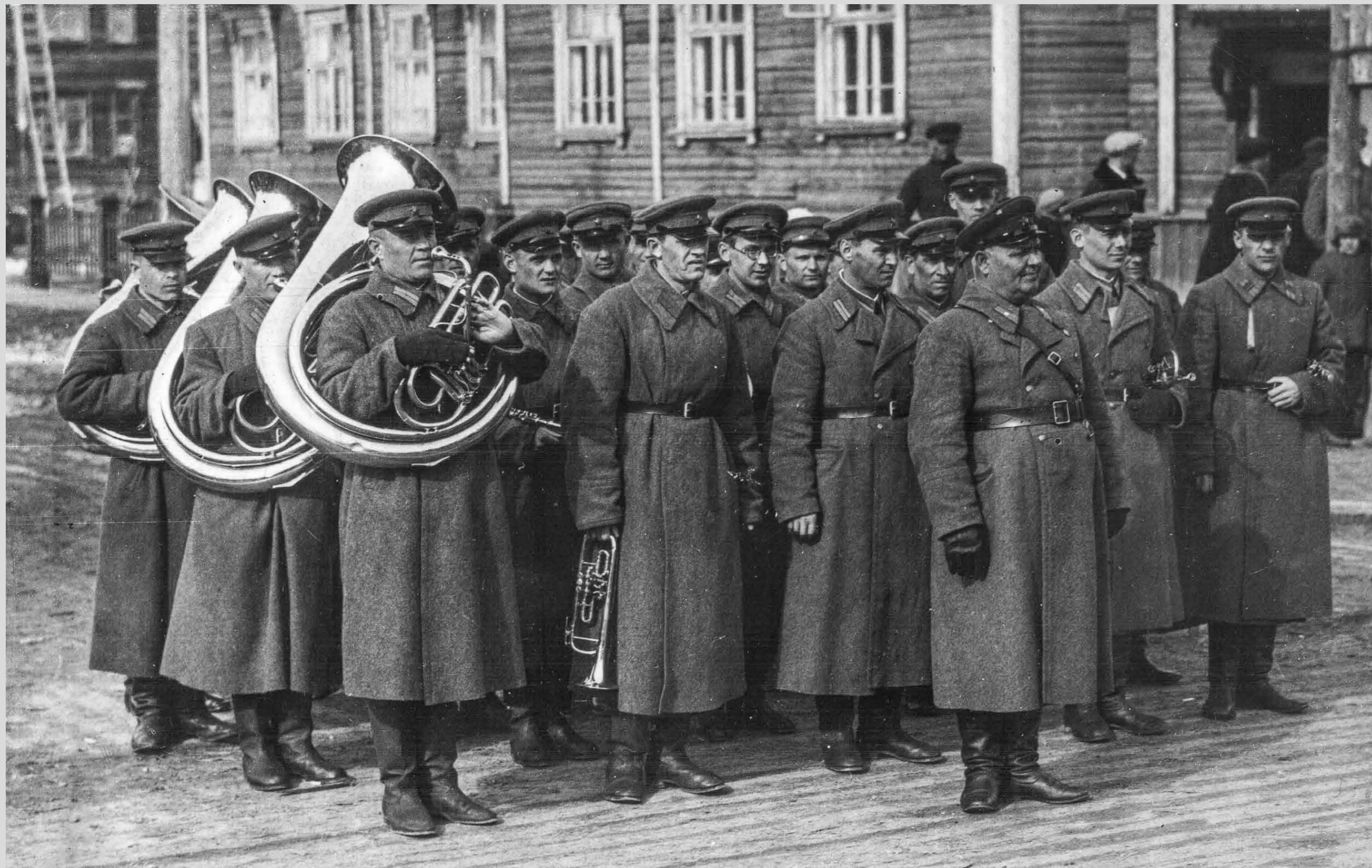
Оркестр ВОХРа завода перед началом парада. 1 мая 1941 года