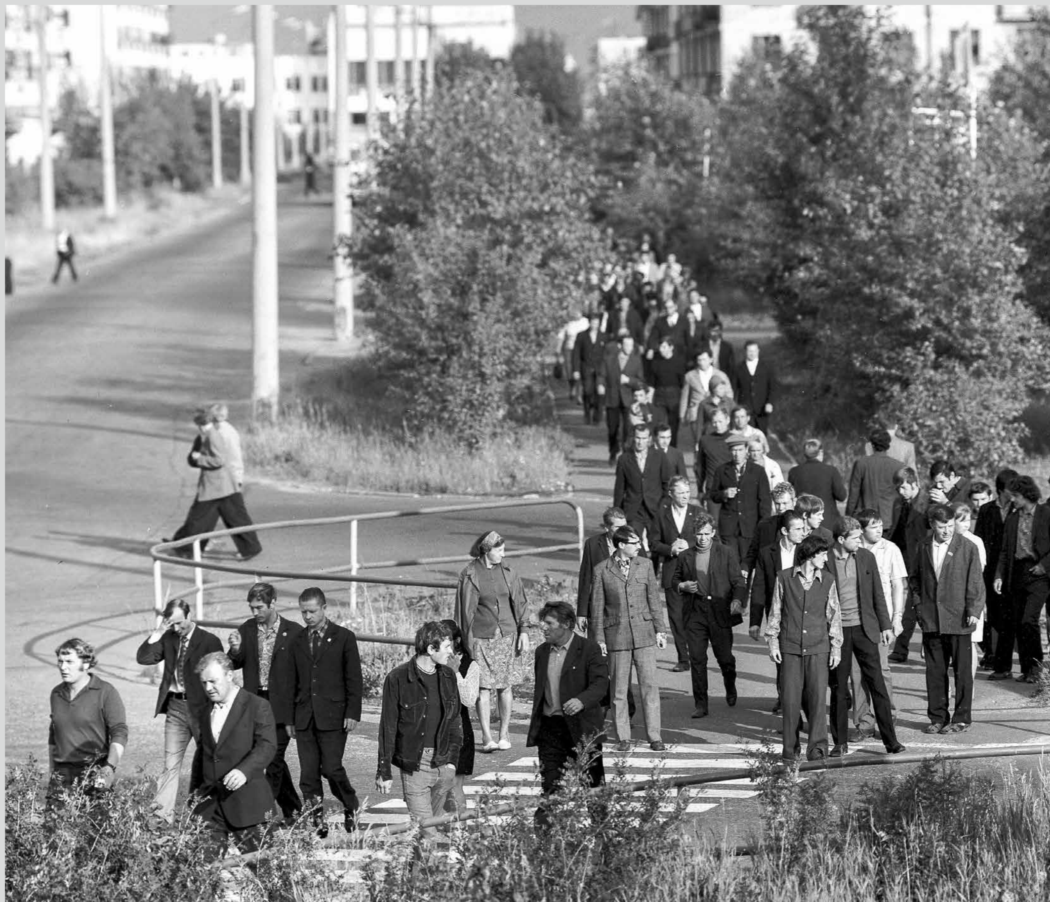
Идет рабочая смена. о. Ягры, 1970-е годы