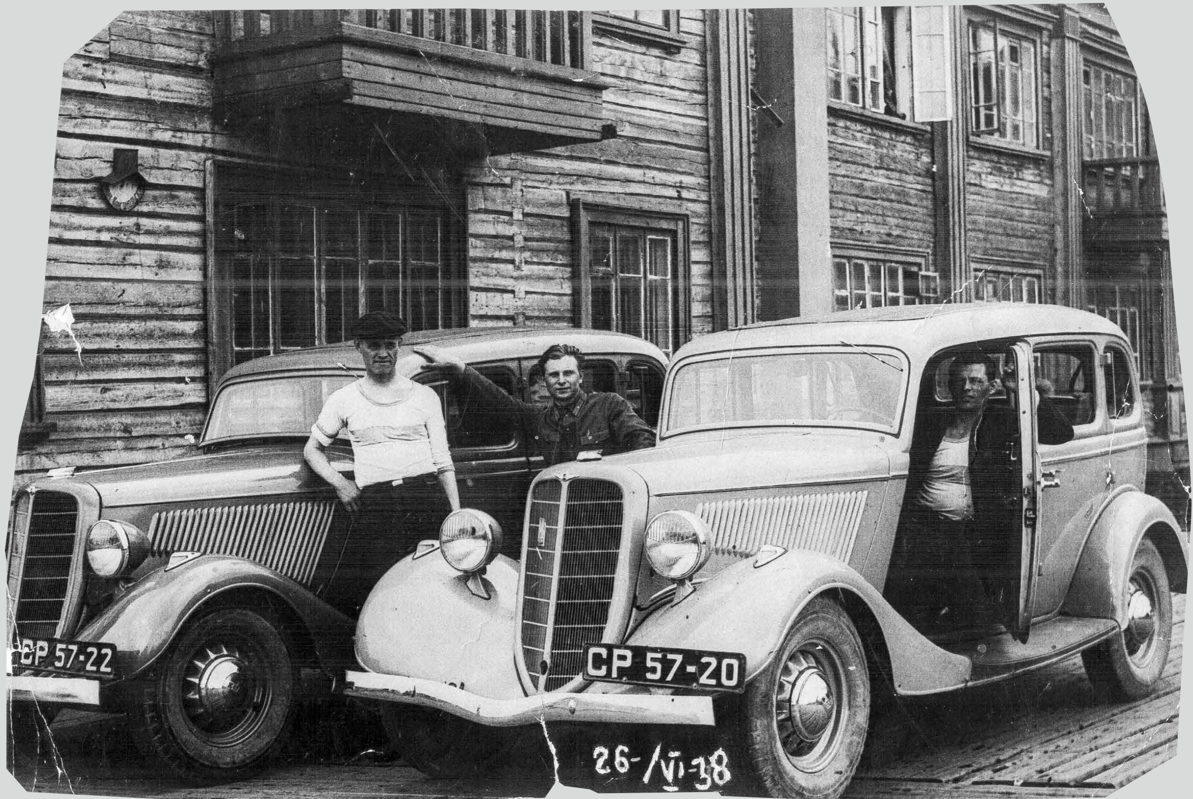
Автомобили начальников Управления строительства. 26 июня 1938 год