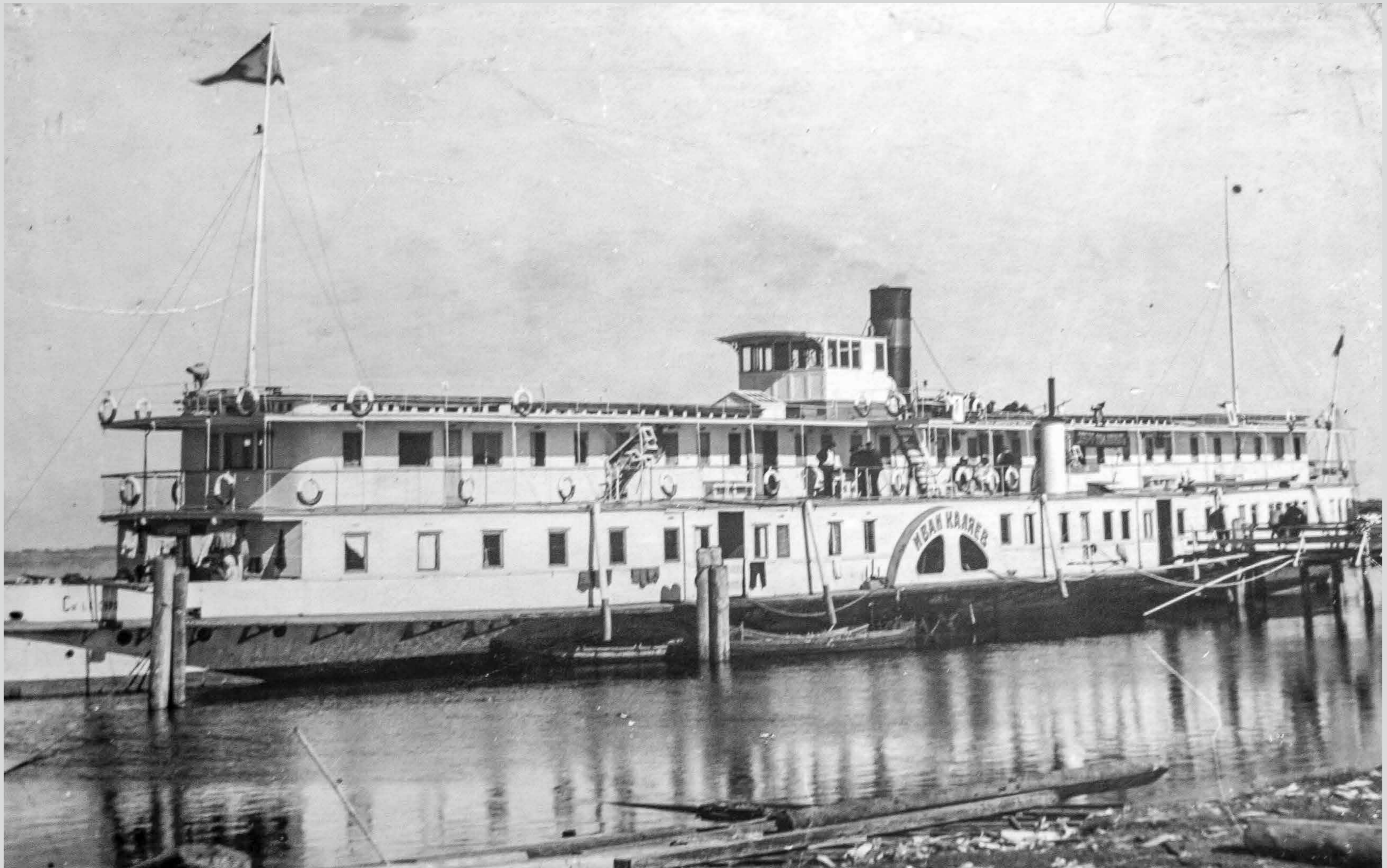
Пароход «Иван Каляев». Лето 1936 года