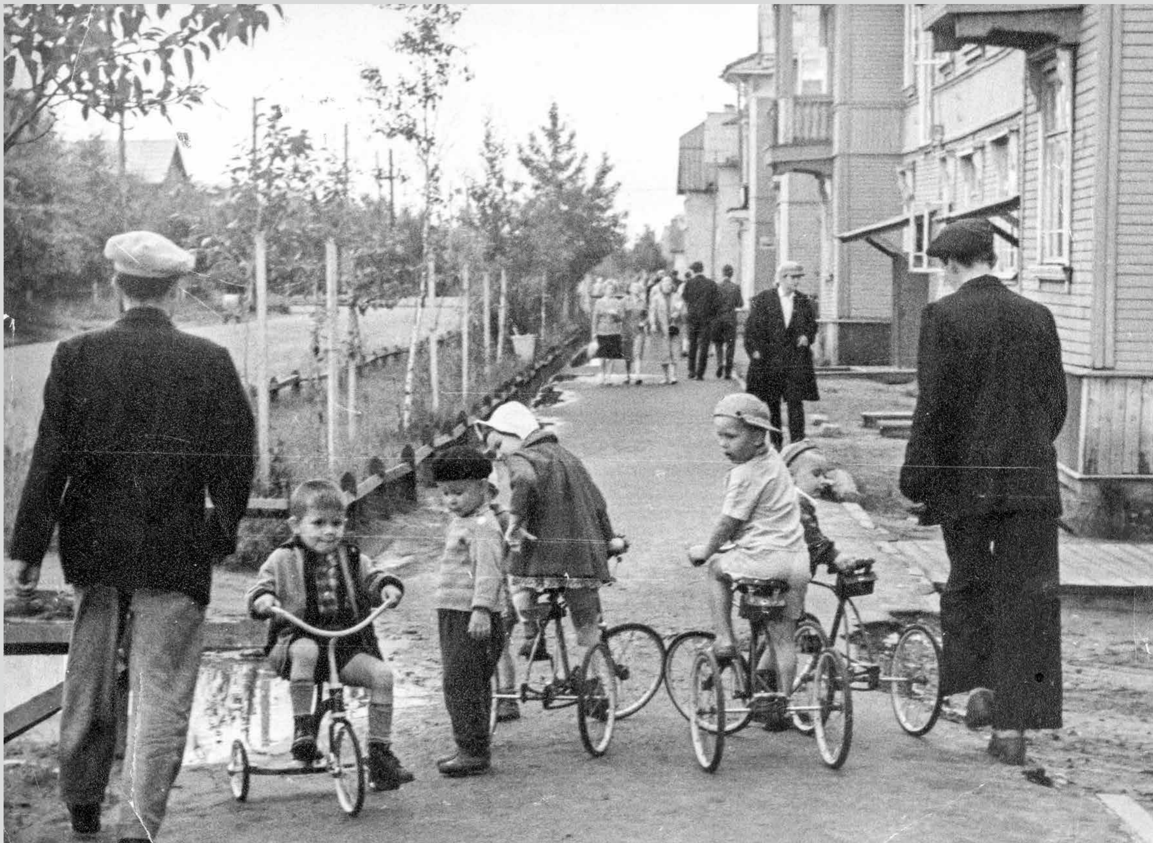
Ул. Советская. 1950-е годы