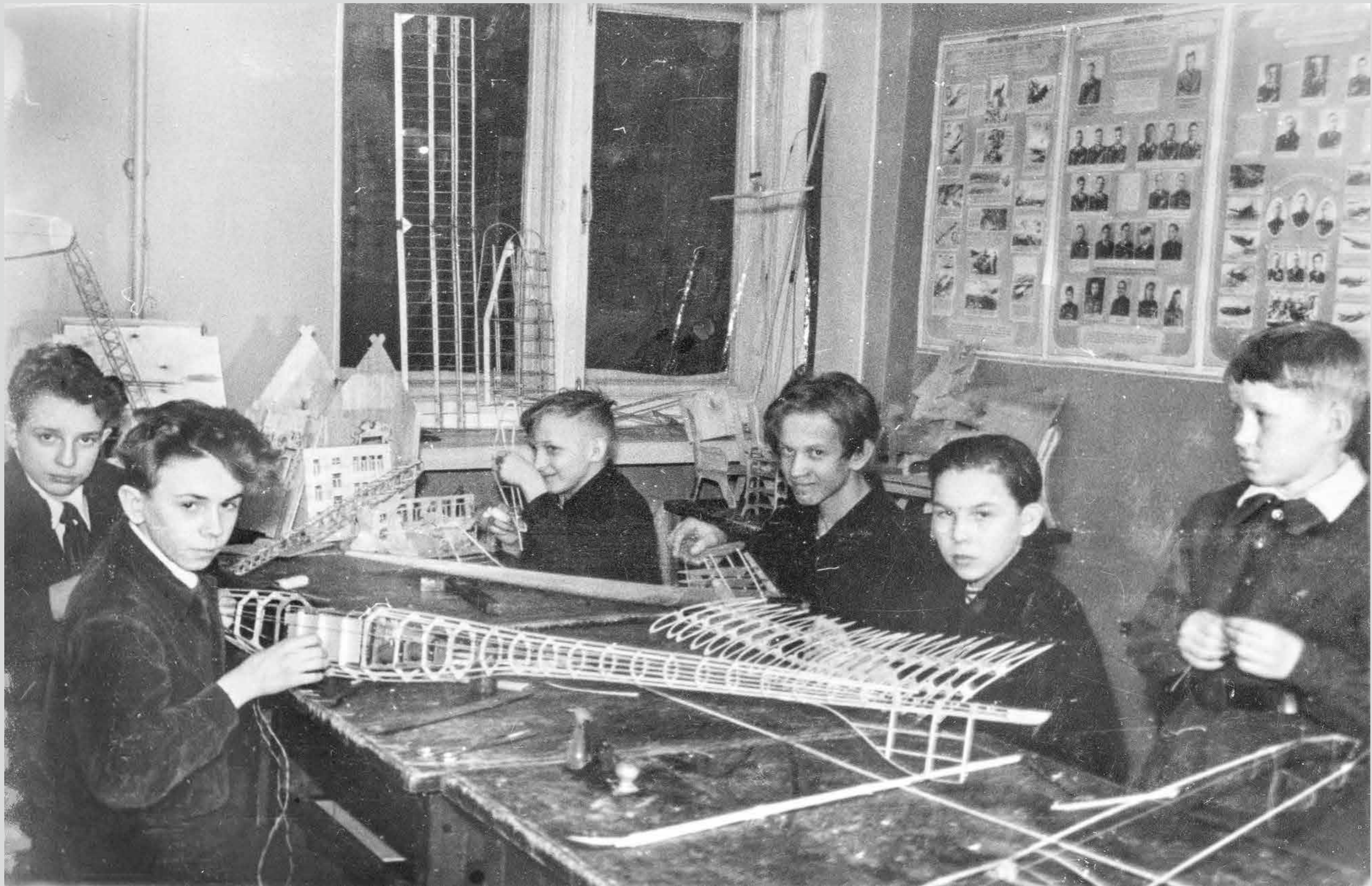
В кружке авиамodelистов Дворца пионеров. 1960-1961 годы