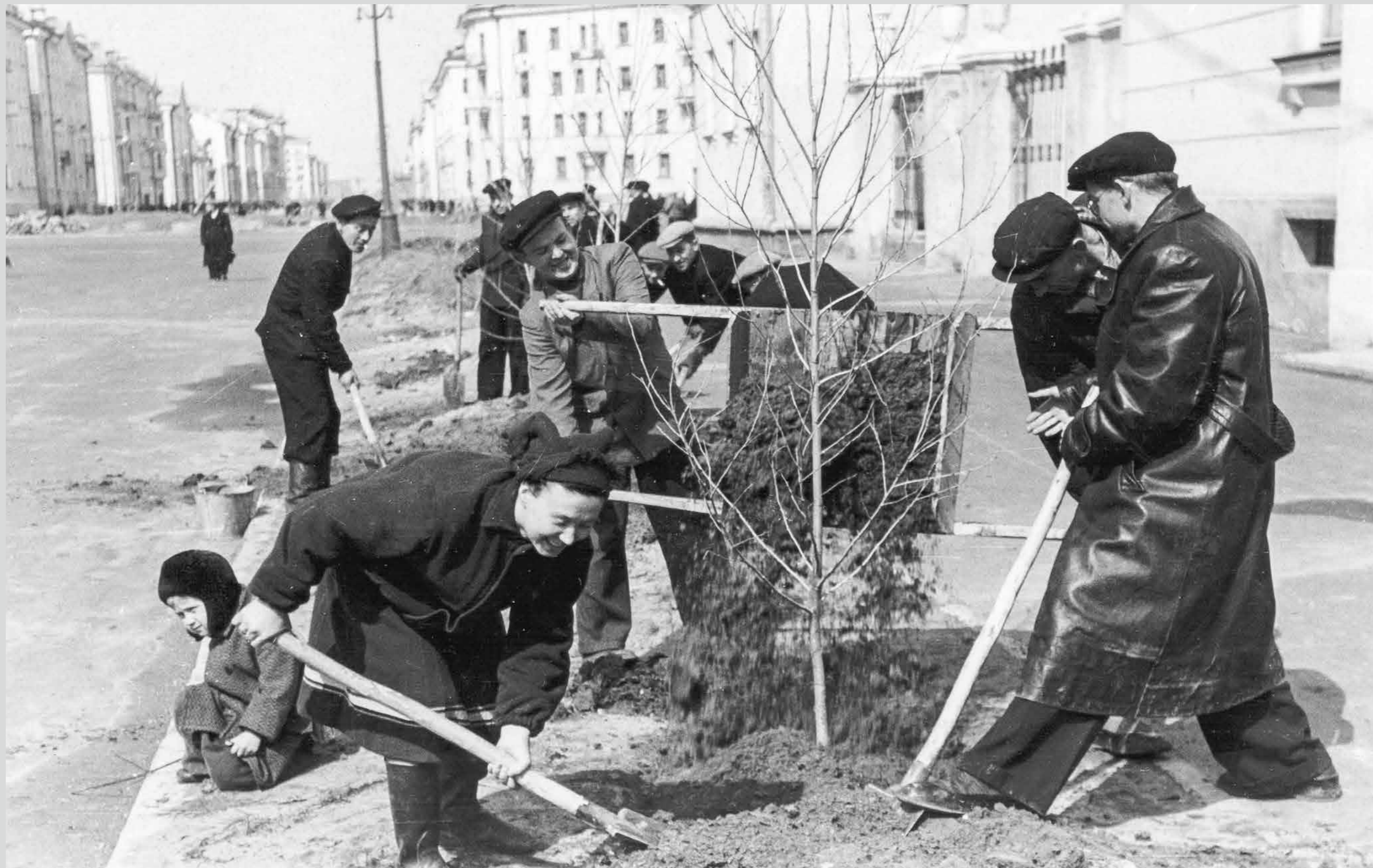
Работы по озеленению города. Середина 1950-х годов