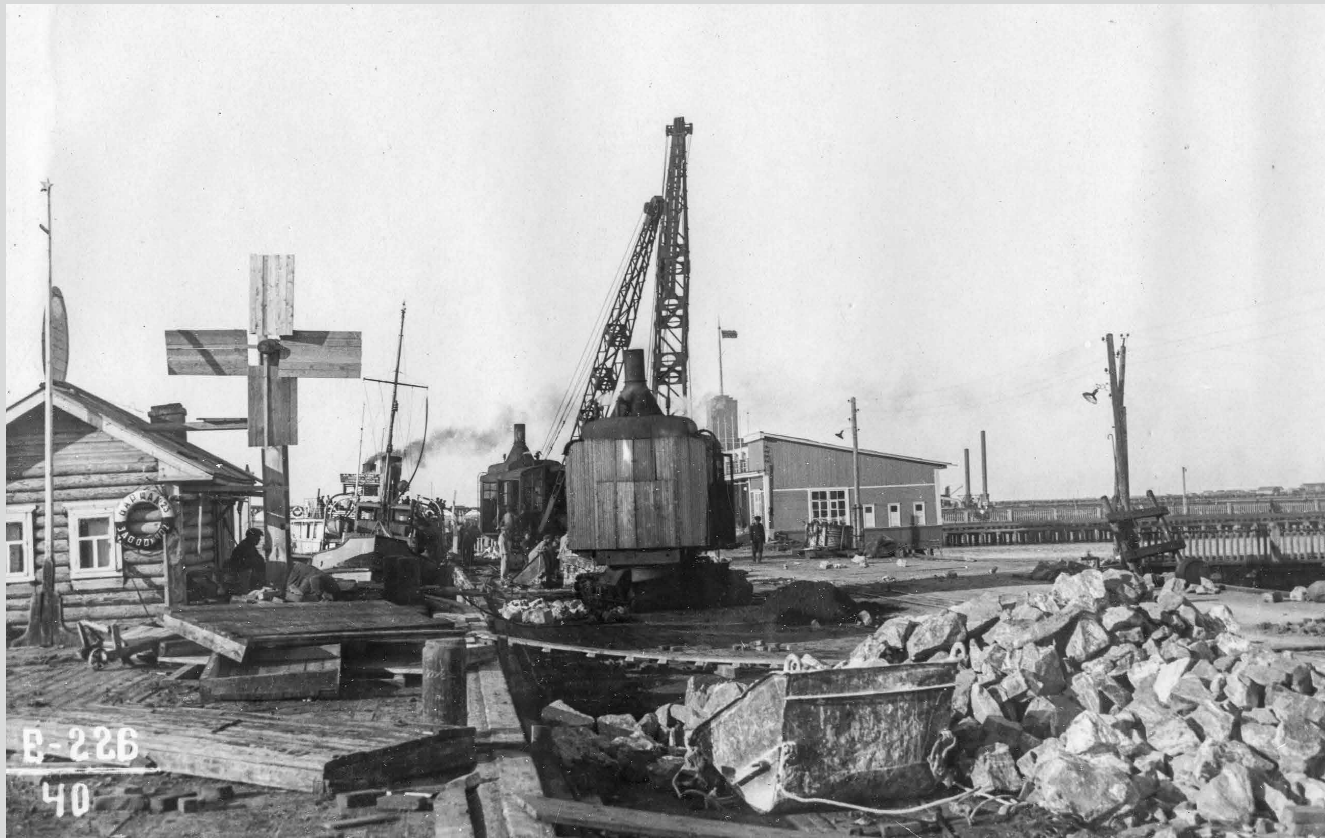
На причалах Судостроя. Идет разгрузка баржи. 3 июня 1938 года