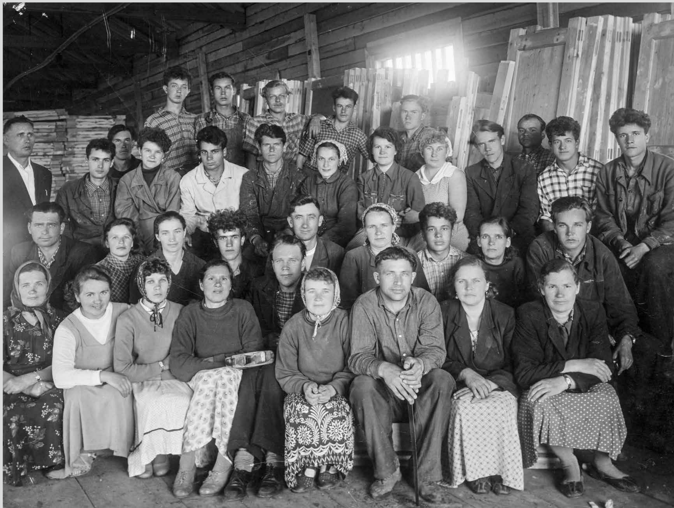
Коллектив столярного цеха ДОК-2 (деревообрабатывающего комбината). 1961 год