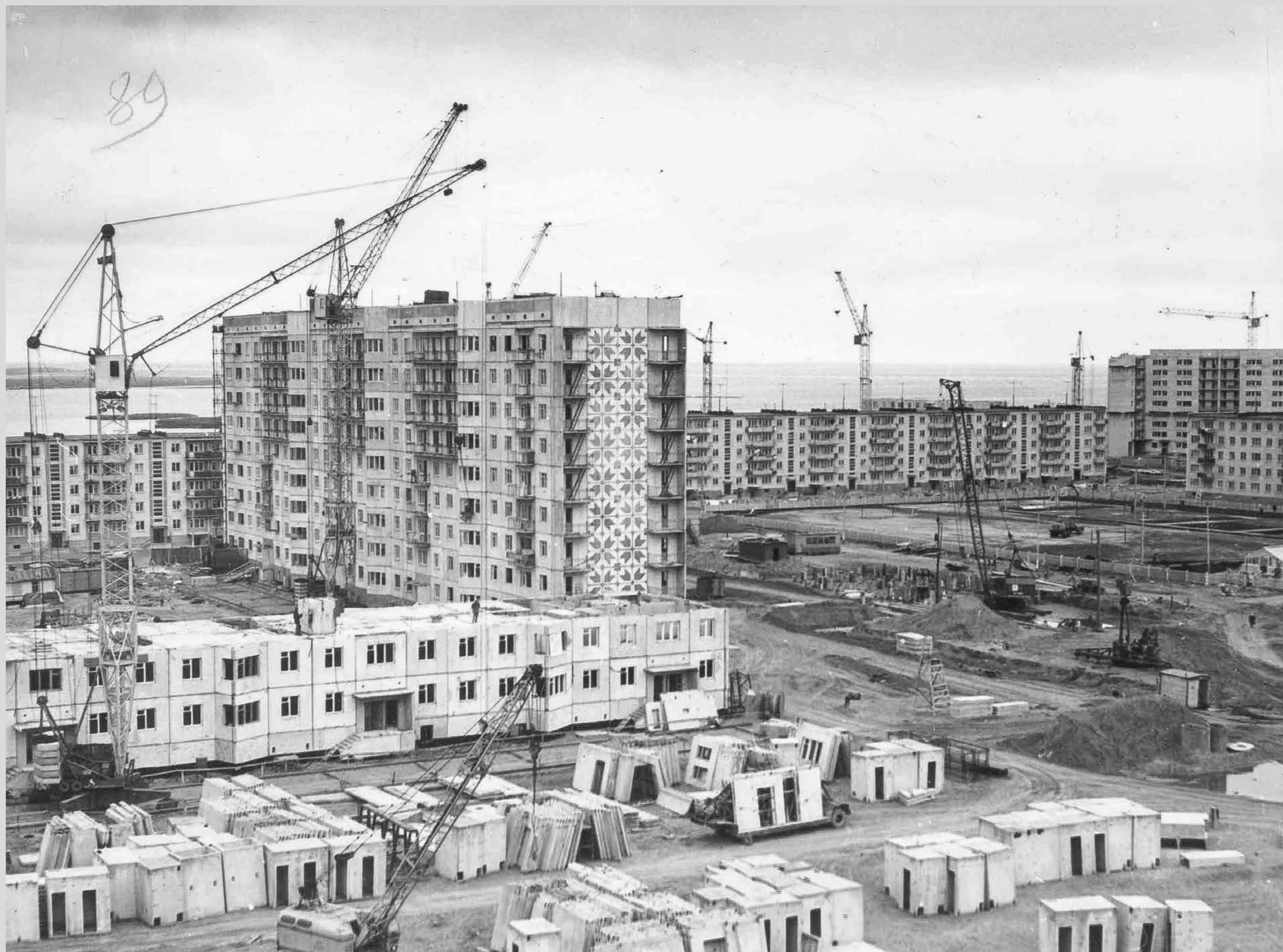
Город строится. 1980-е годы