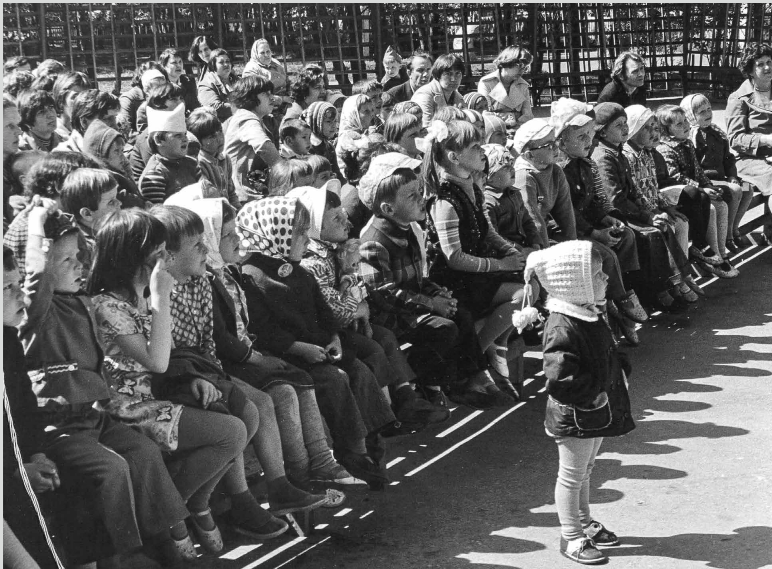
Праздник для детей в городском парке. 1970-е годы