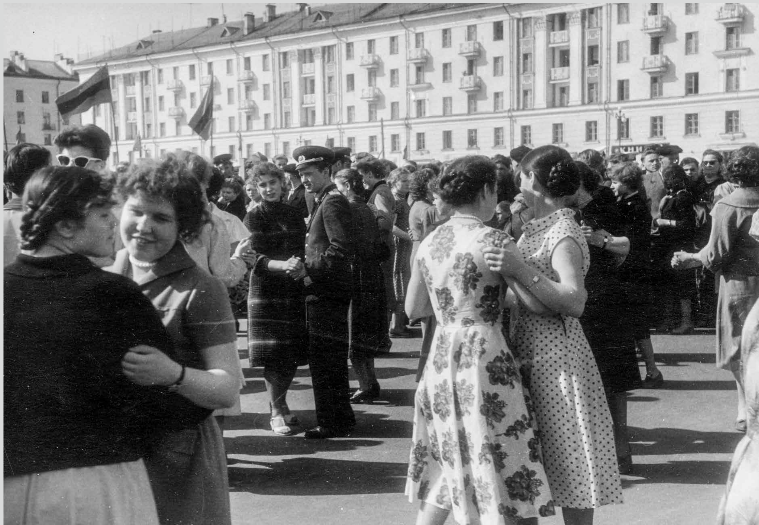
Советская площадь. 2 мая 1959 года