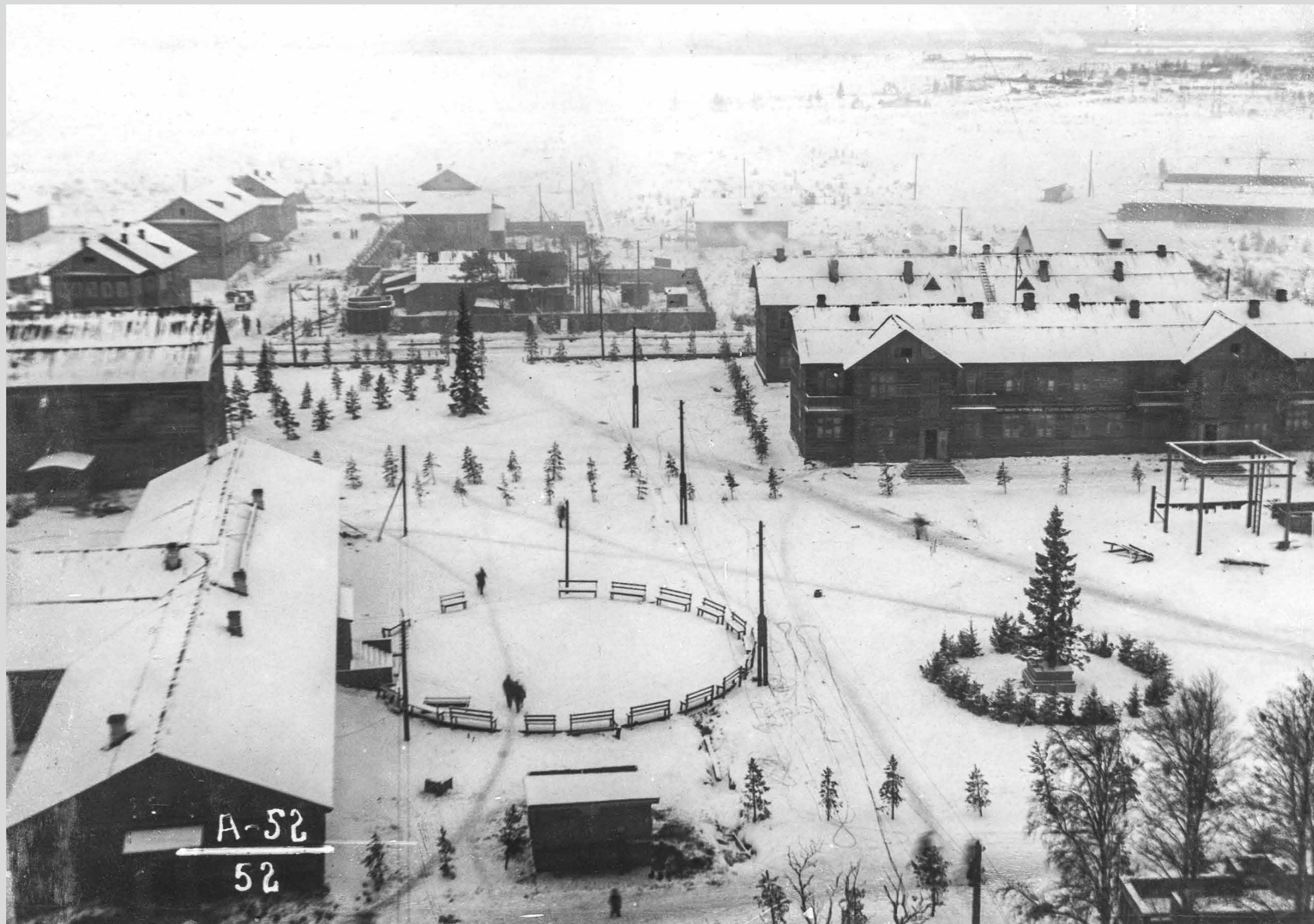
Первая елка поселка. Декабрь 1936 года