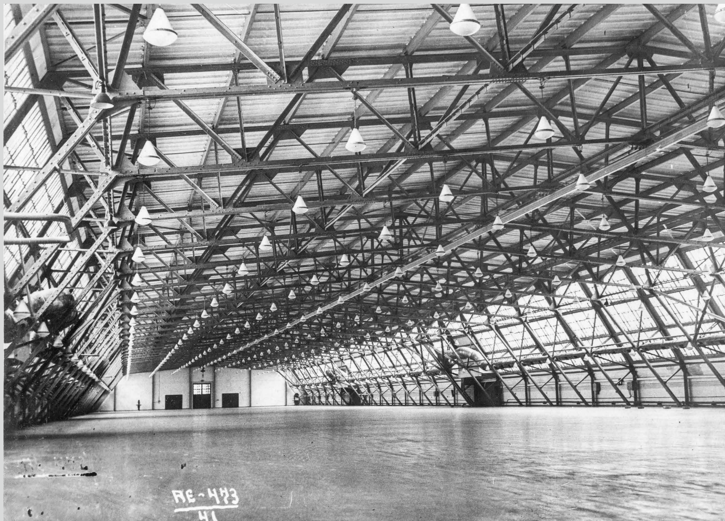
Цех судостроительного завода № 402. Конец 1930-х гг.