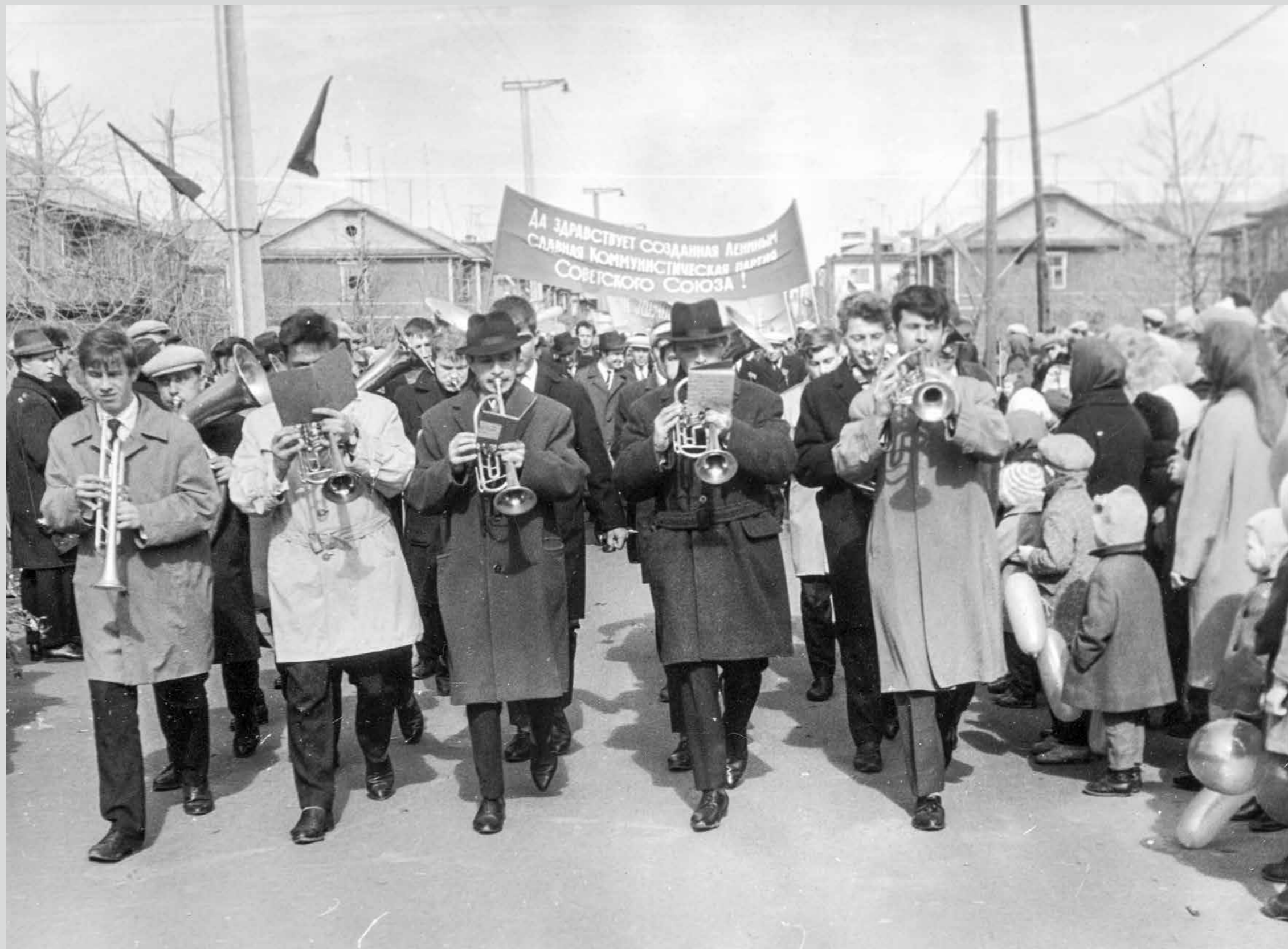
Колонна демонстрантов АТК (автотранспортная контора). Впереди духовой оркестр. 1 мая 1966 года