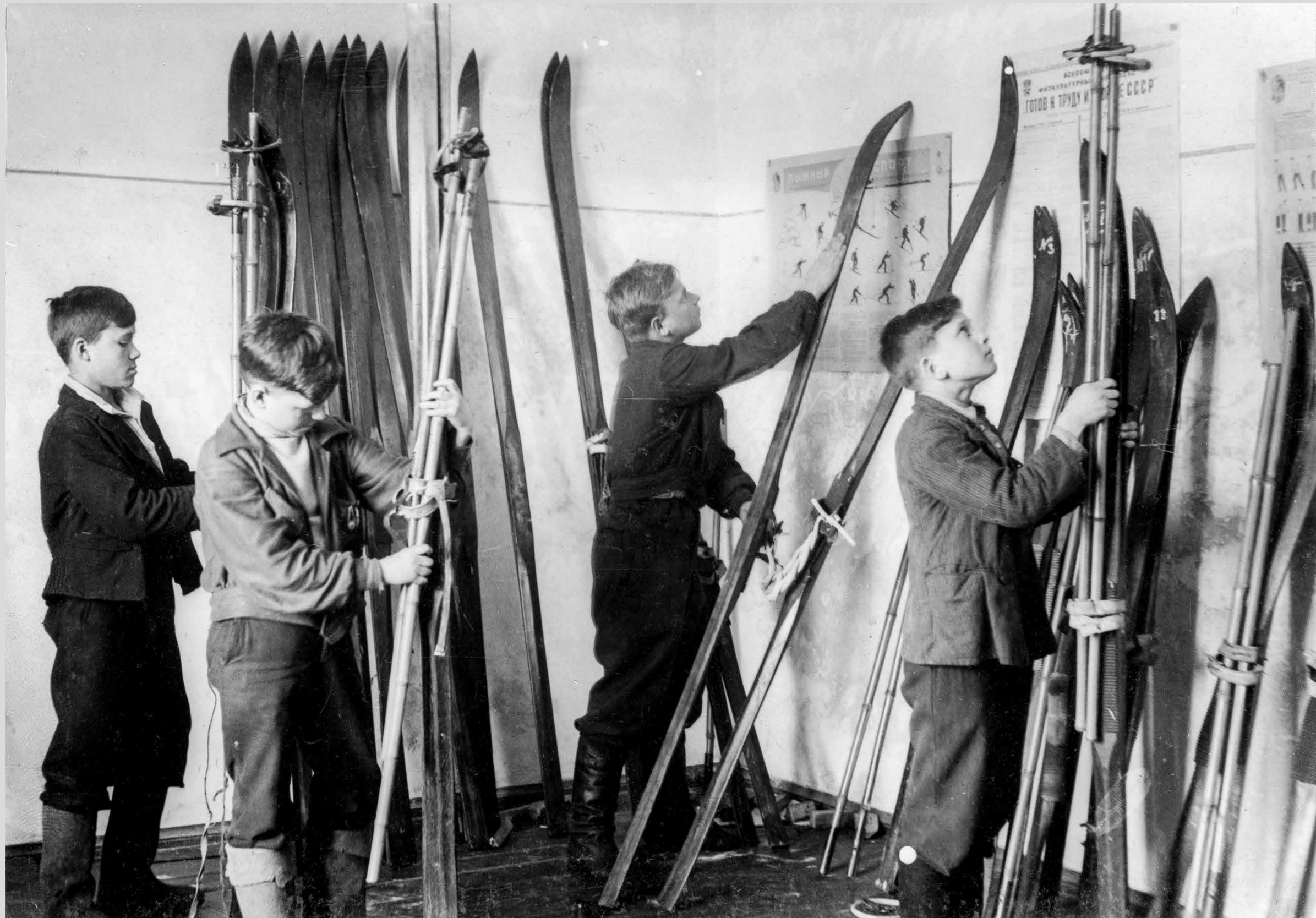
Дом пионеров. Спортивная секция. Конец 1930-х гг.