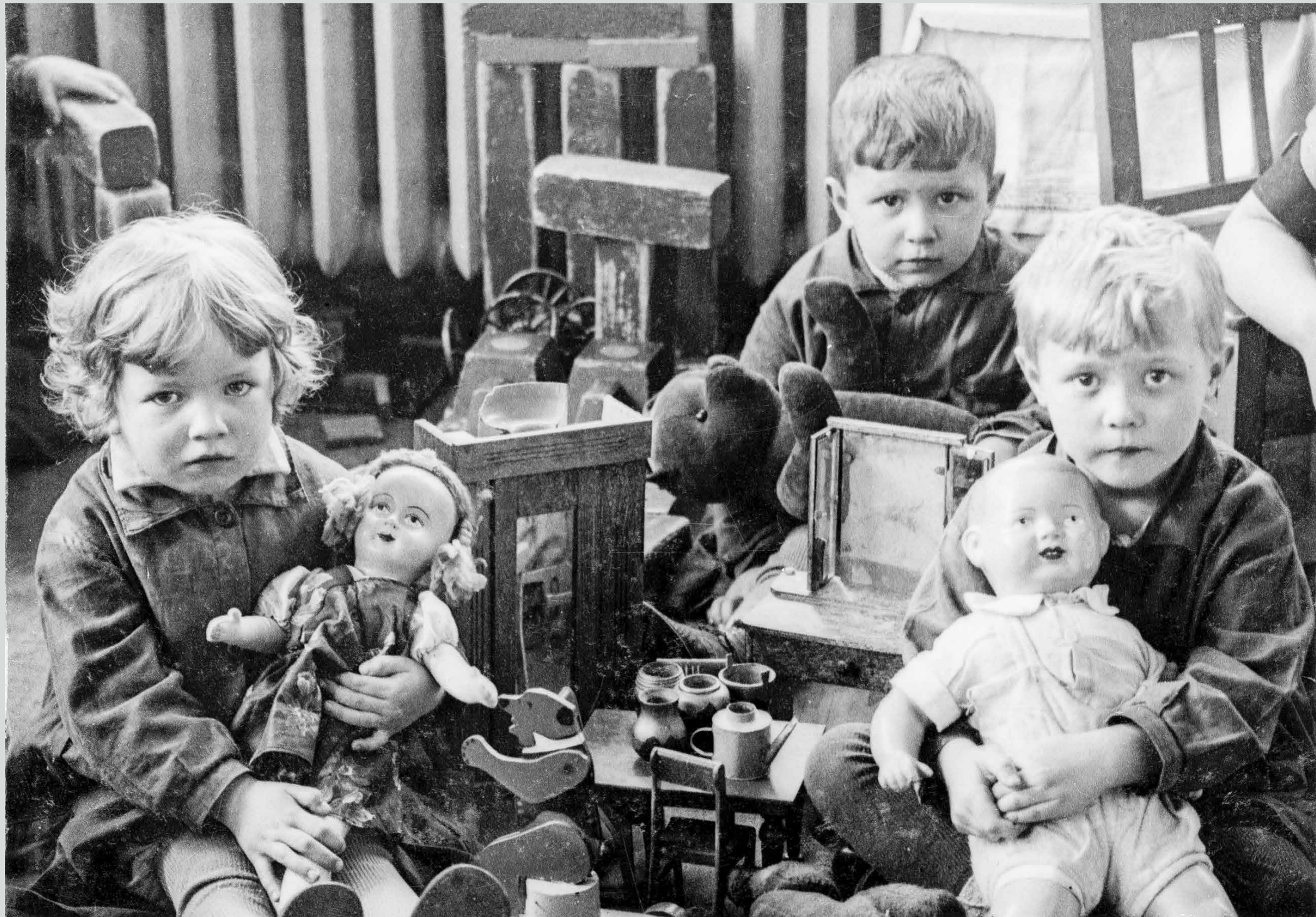
В детском саду г. Молотовска. 1939 год