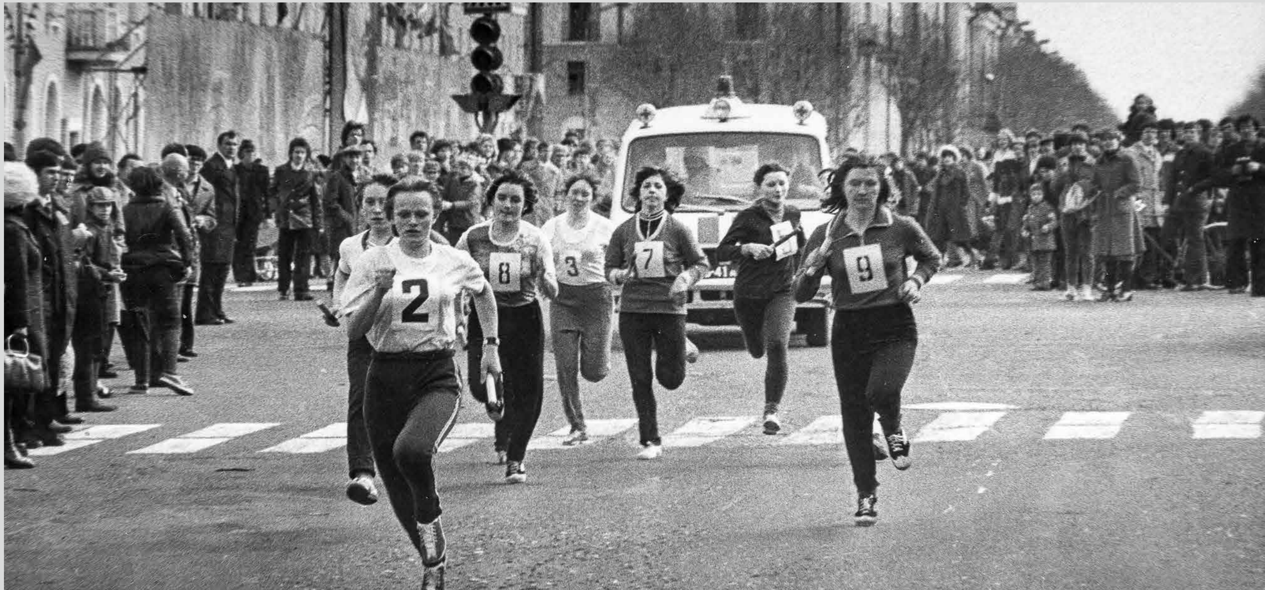
Традиционная первомайская эстафета на приз газеты «Северный рабочий». 1982 год