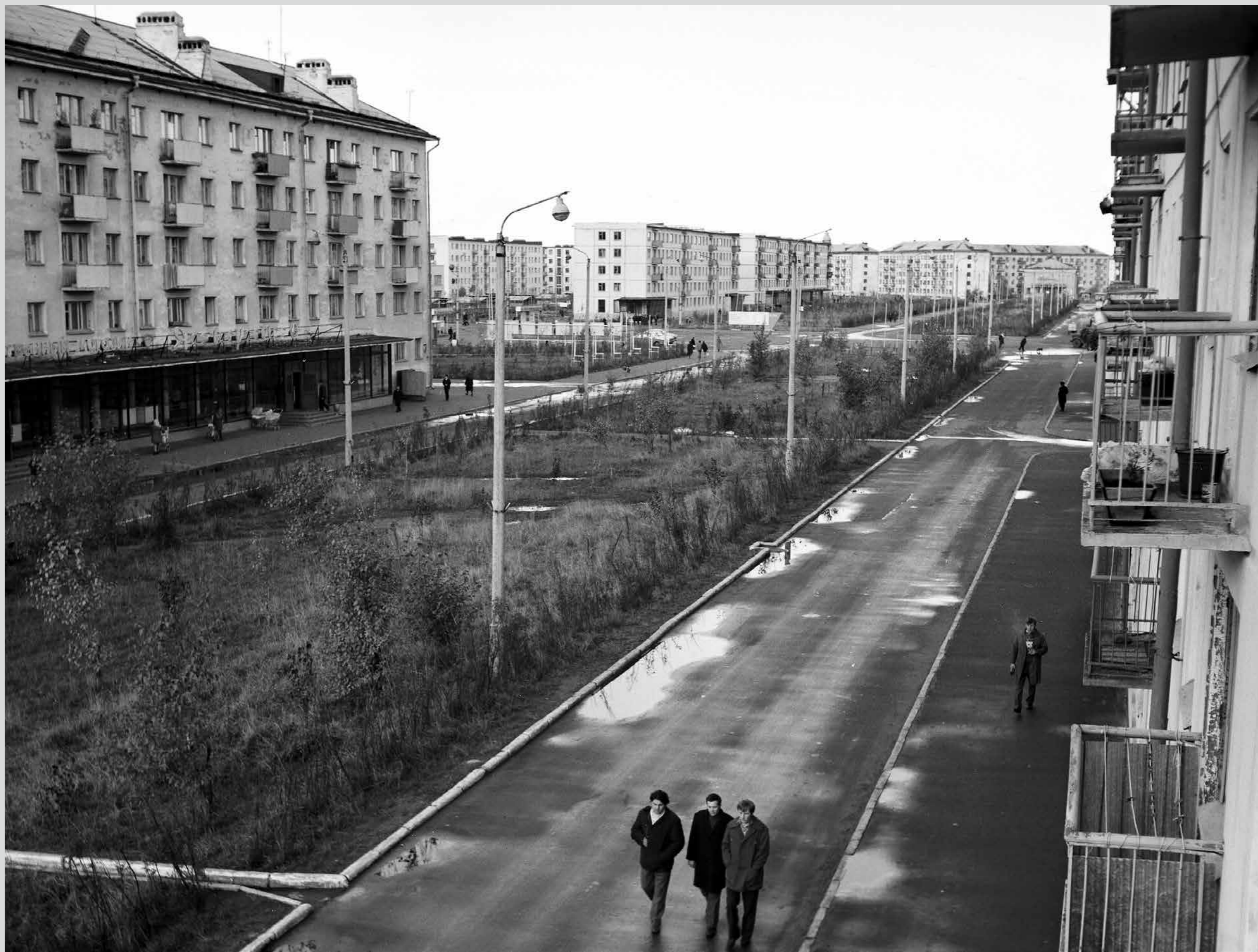
Улица Мира. О. Ягры, конец 1960 – начало 1970-х годов