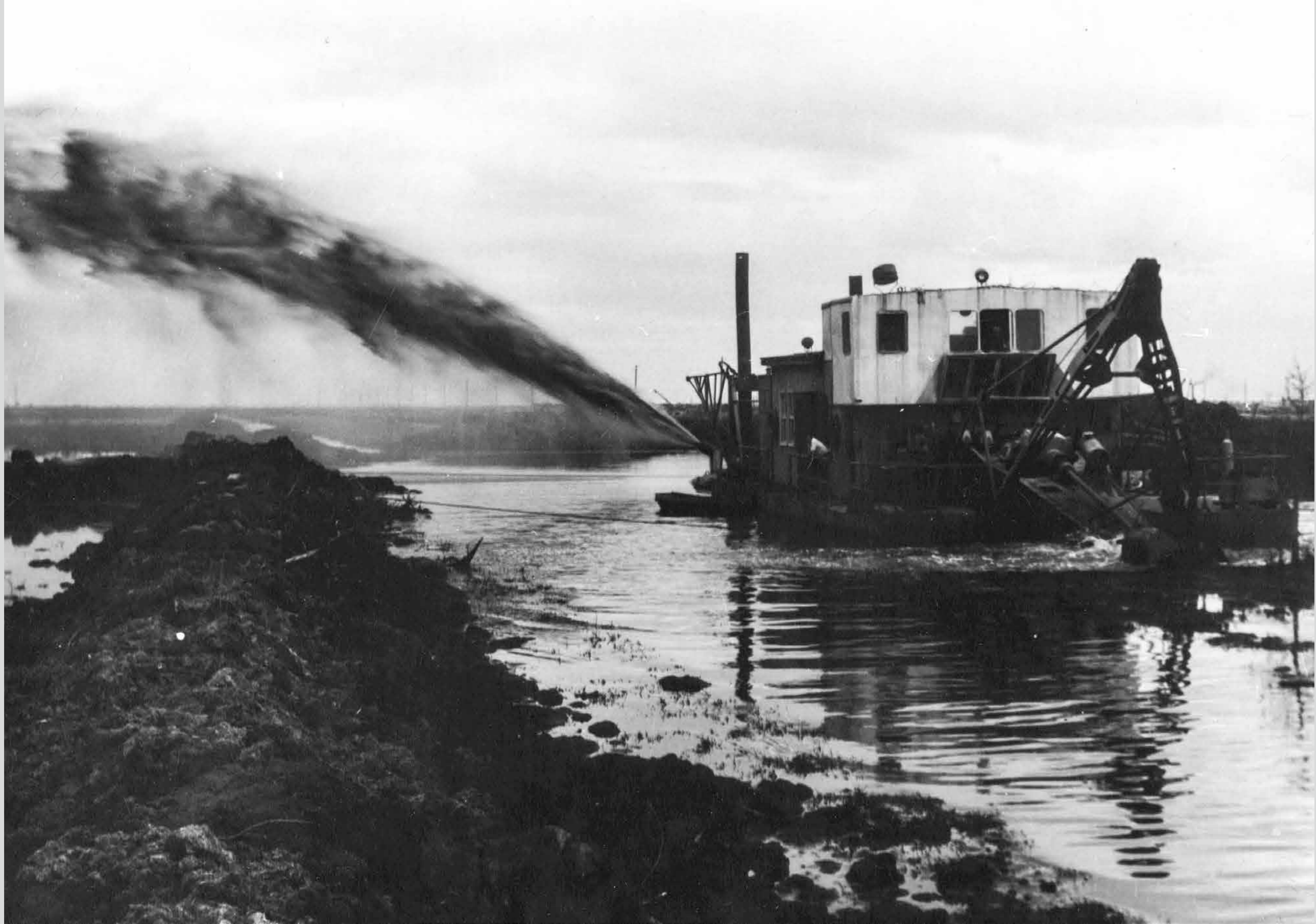
Гидромеханизированная разработка торфа. Август 1974 год