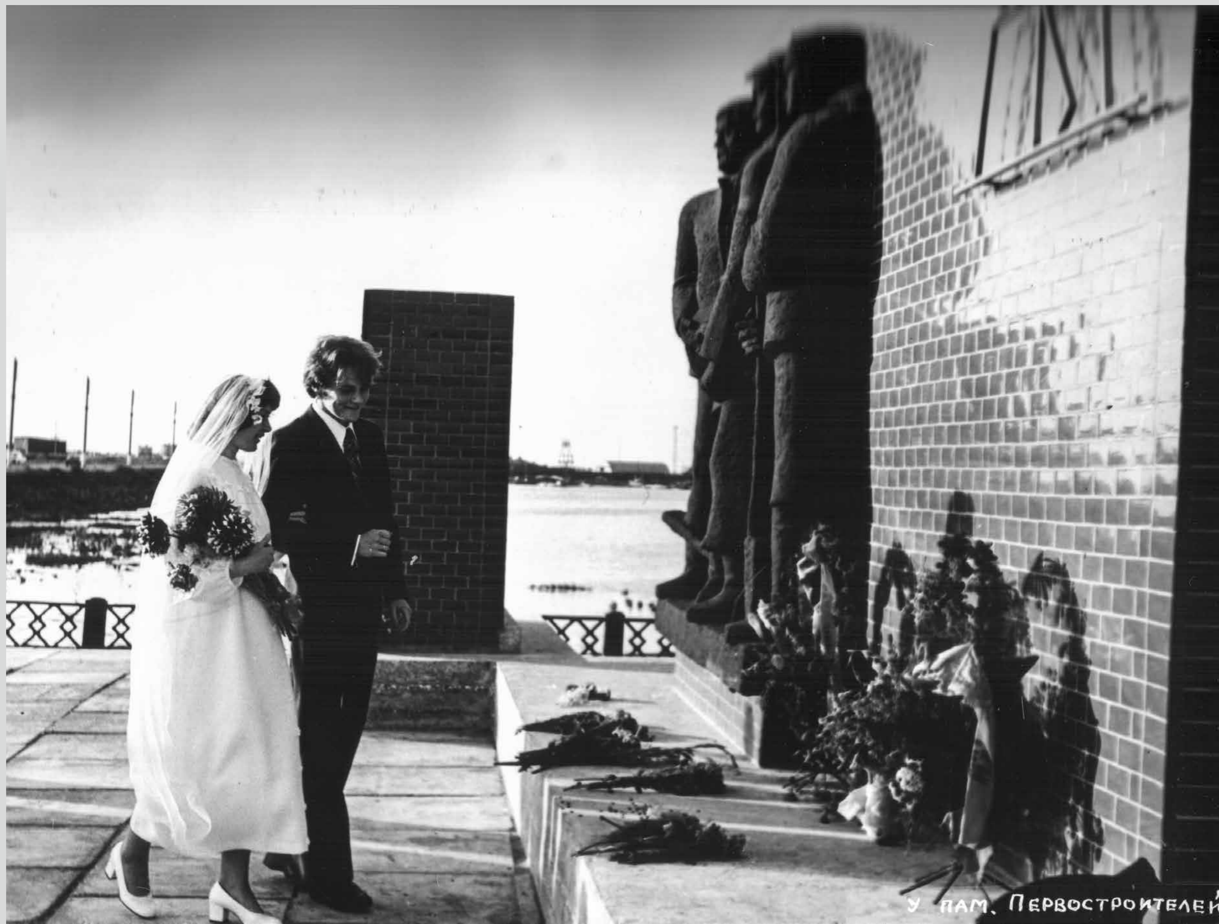
Молодожены около памятника первостроителям. Начало 1980-х годов