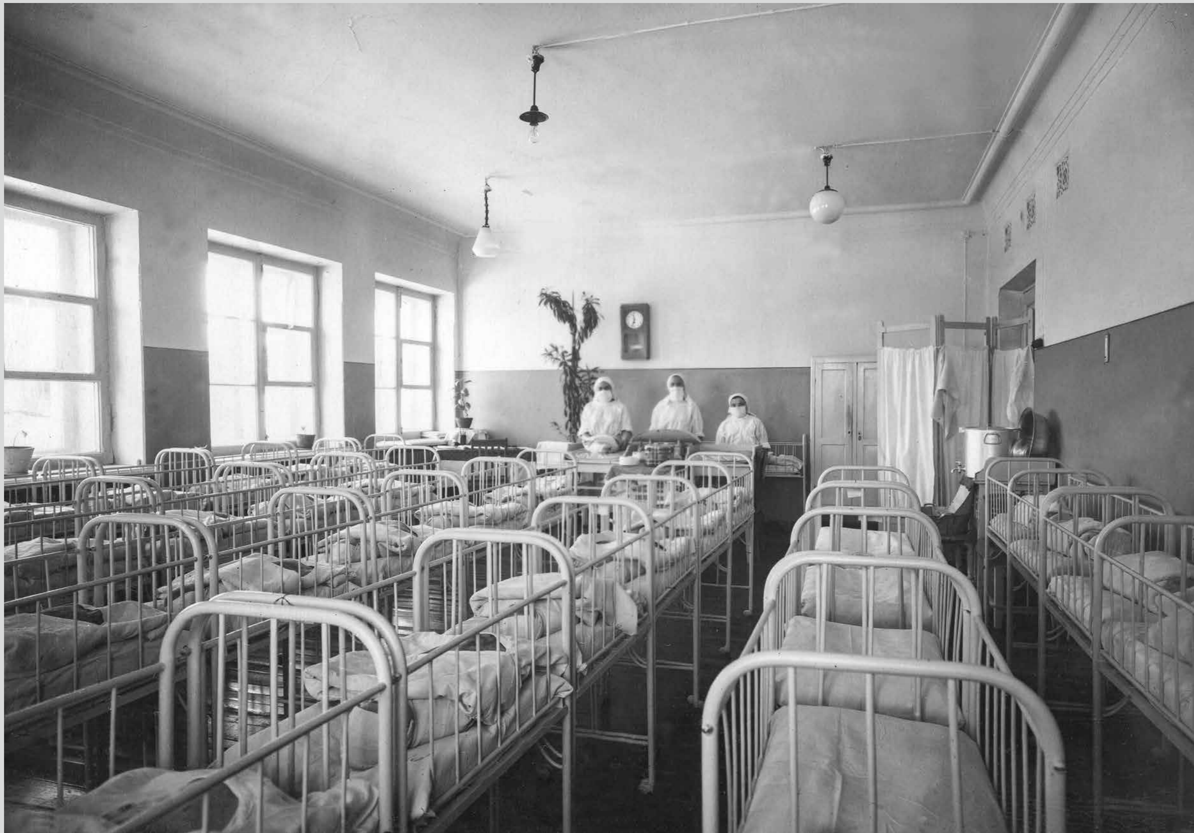
Палата для новорожденных. Родильный дом на ул. Пионерской, 10. Вторая половина 1950-х годов