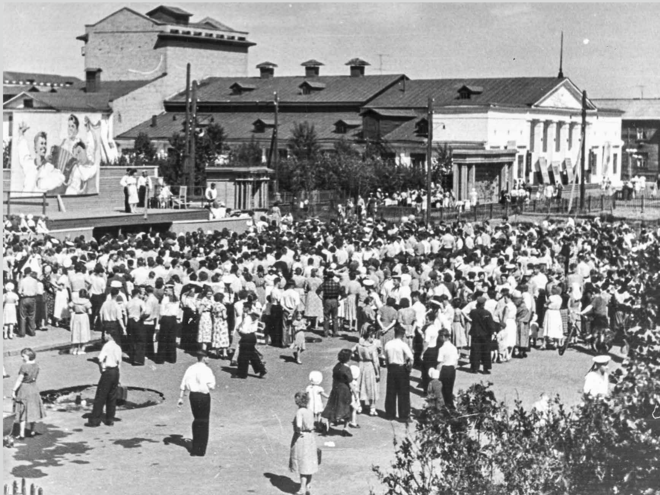
Праздник молодёжи. 29 июня 1958 года