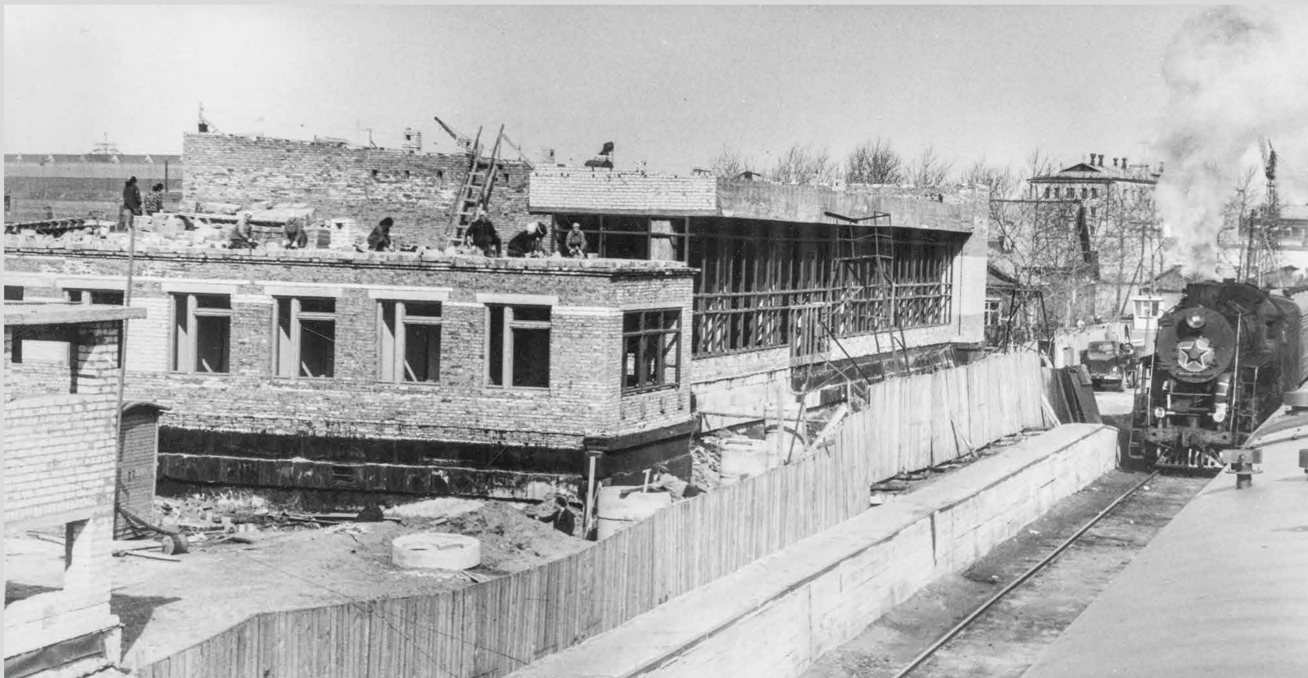
Идет строительство нового здания железнодорожного вокзала. Начало 1970-х годов