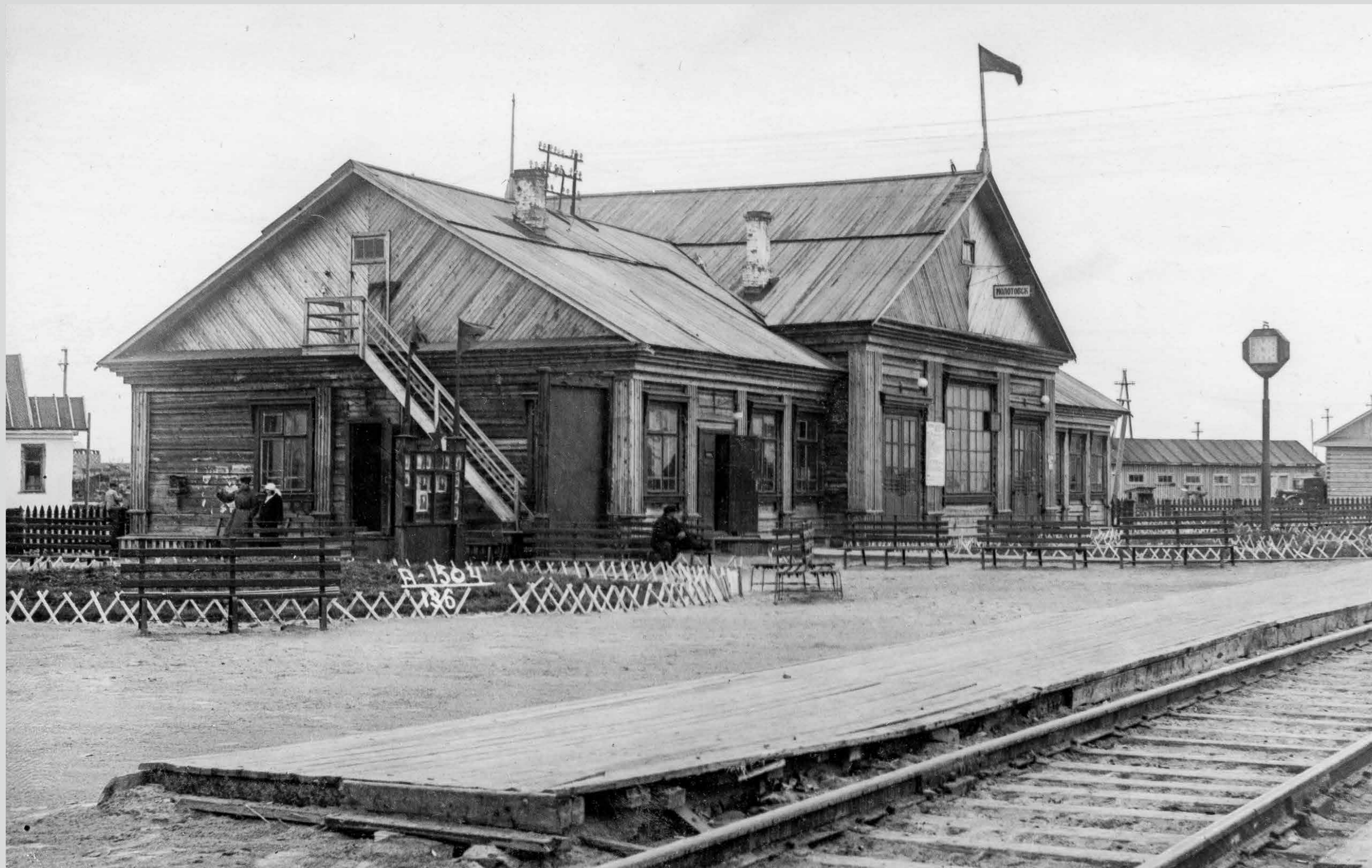
Первый железнодорожный вокзал г.Молотовска. 1939