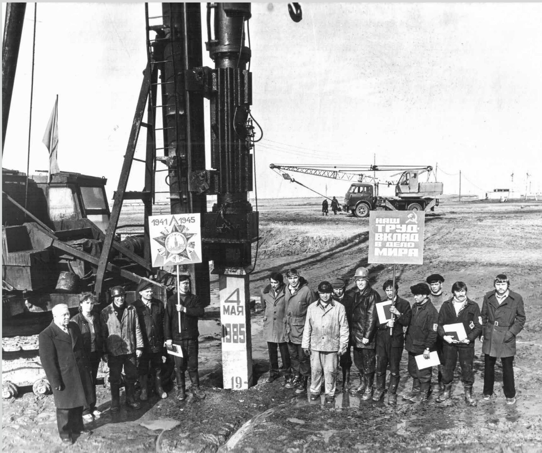
Забивка первой сваи в микрорайоне Юбилейный, субботник в честь 40-летия Победы. 4 мая 1985 года