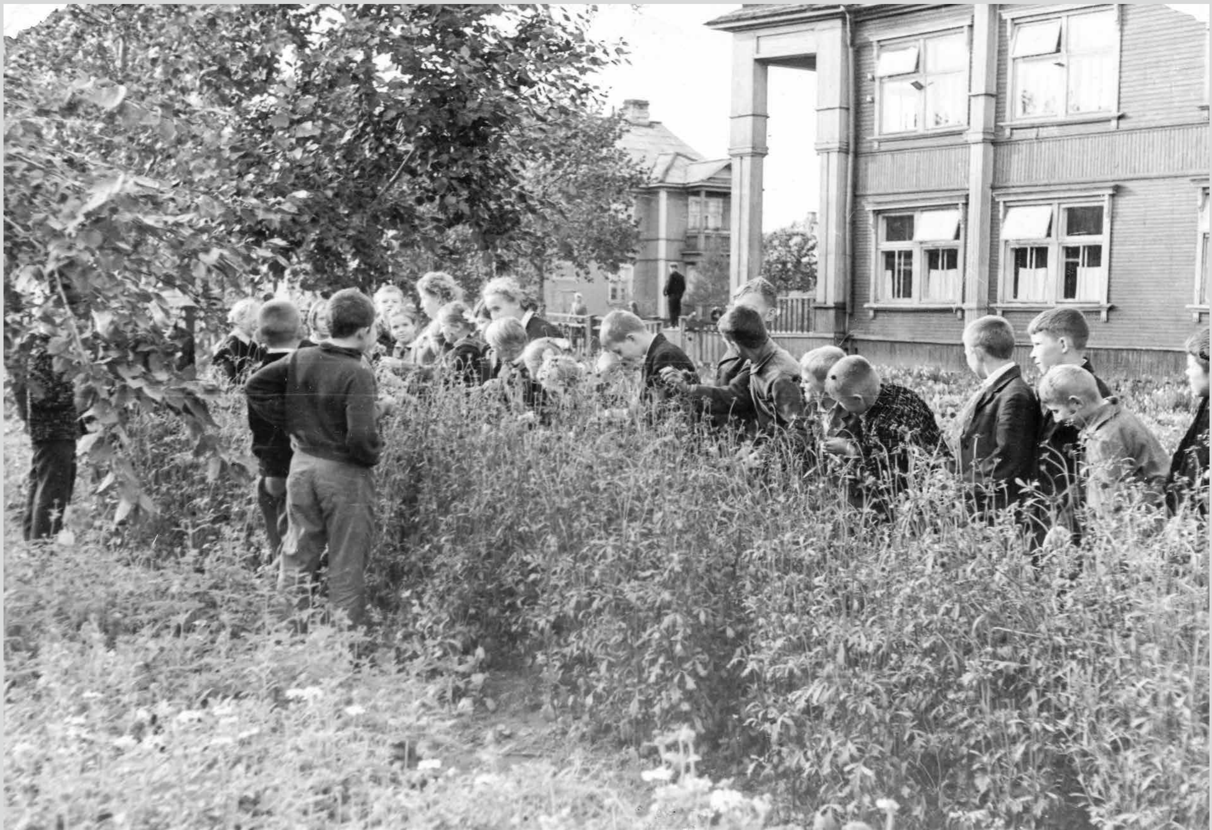
Работы на участке школы № 2. 1966 года