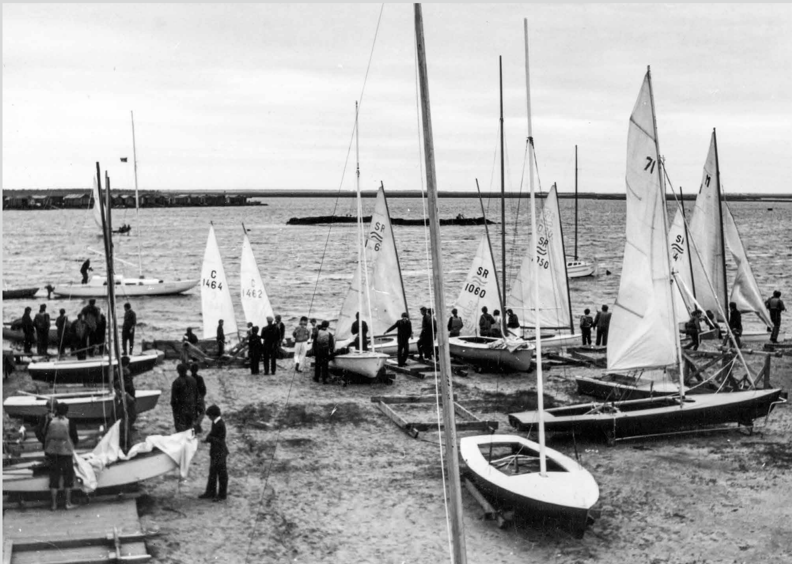
Парусный спорт в Северодвинске. Конец 1970-х гг.