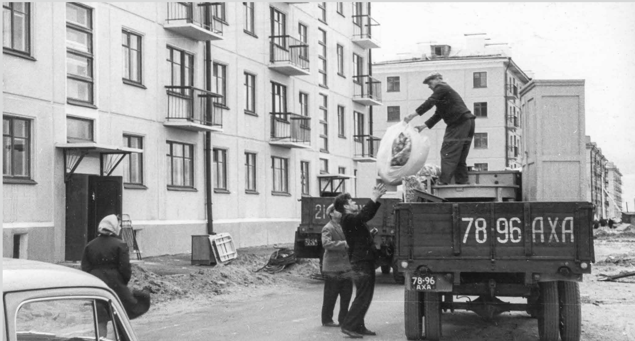
Новоселы. Переезд в новые панельные дома. Конец 1950-х гг.