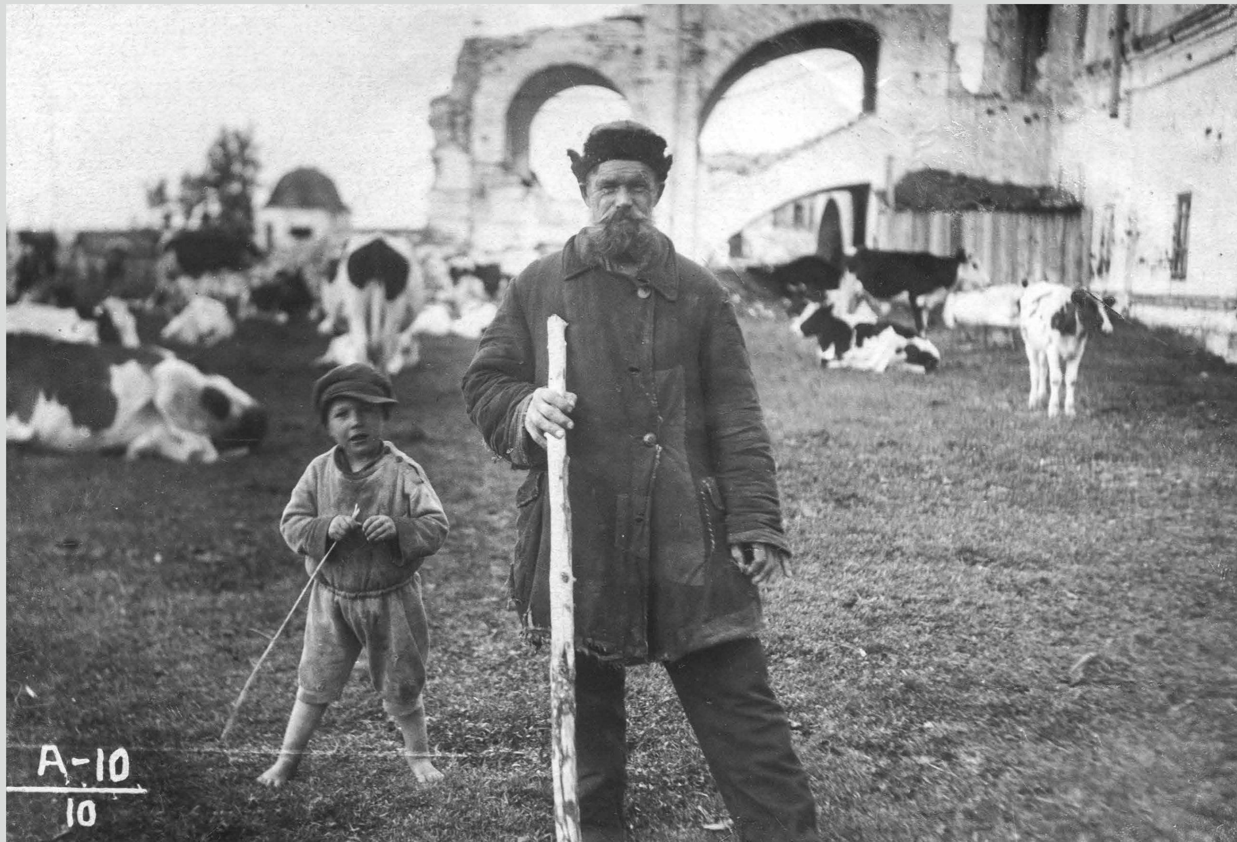
До приезда первостроителей осталось совсем немного. Лето 1936 года