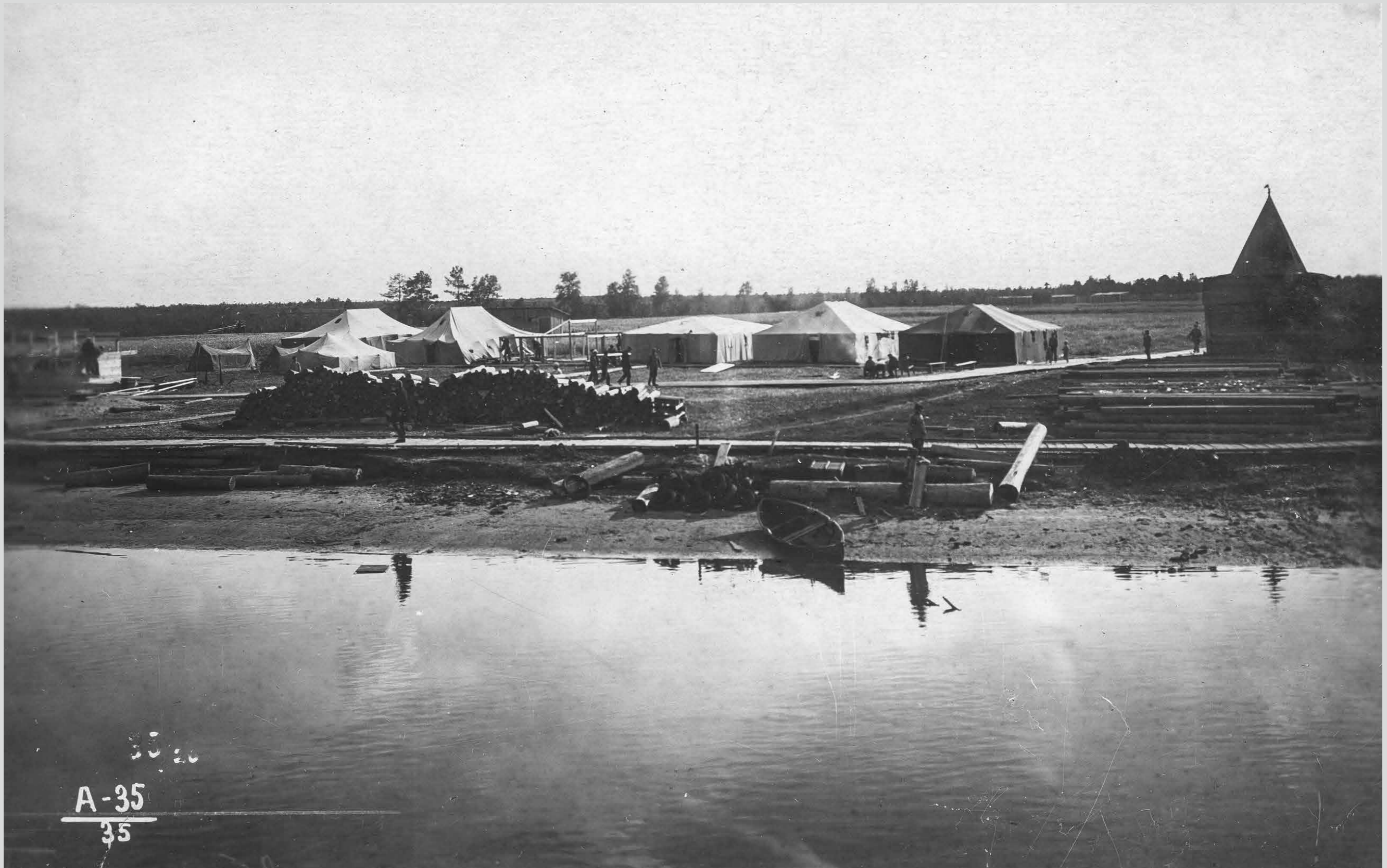
Палатки на берегу около Николо-Корельского монастыря. Лето 1936 года