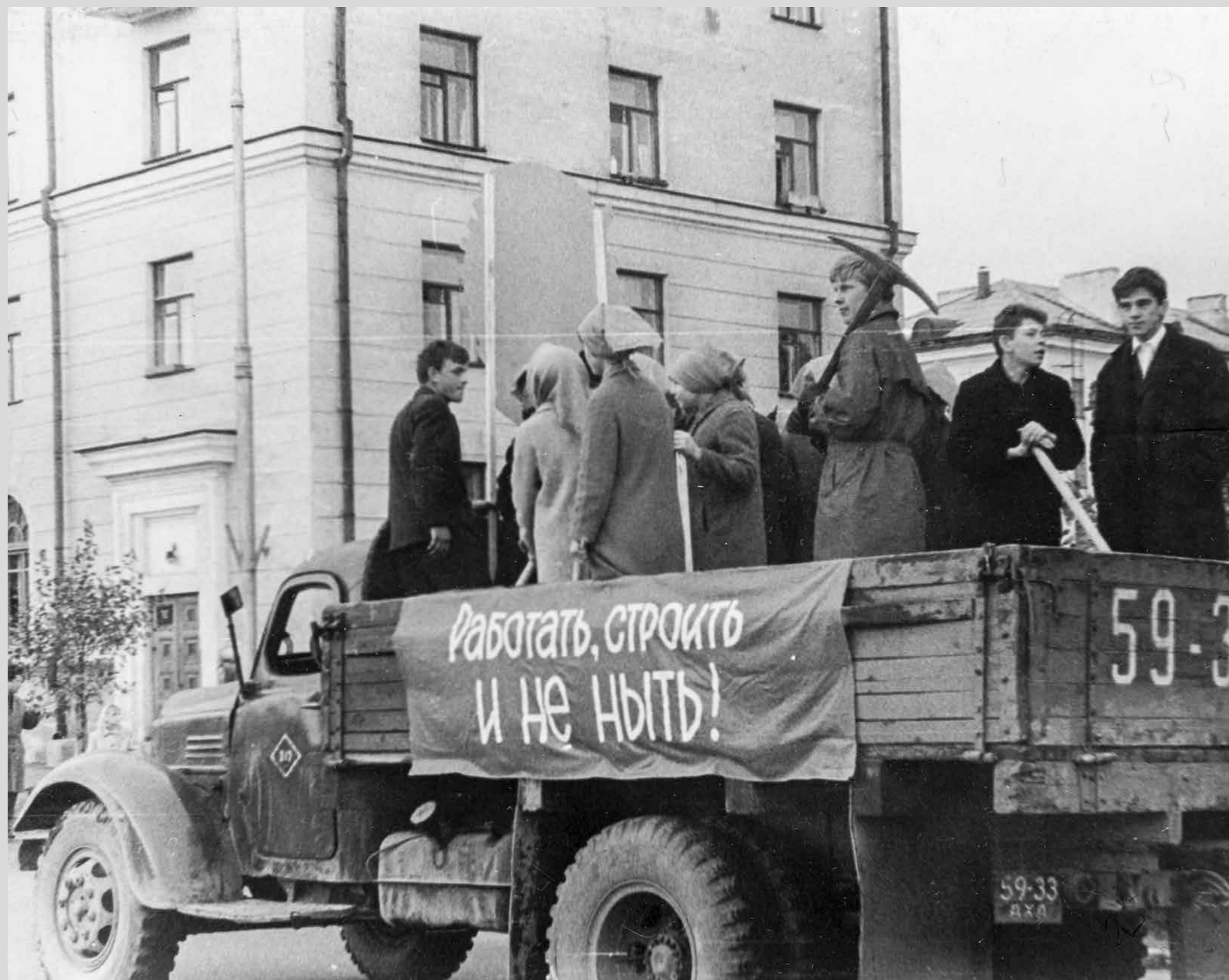
Участники театрализованной колонны «Комсомол на стройках пятилеток» на городском празднике «50 пламенных лет» к юбилею ВЛКСМ. 22 сентября 1968 года