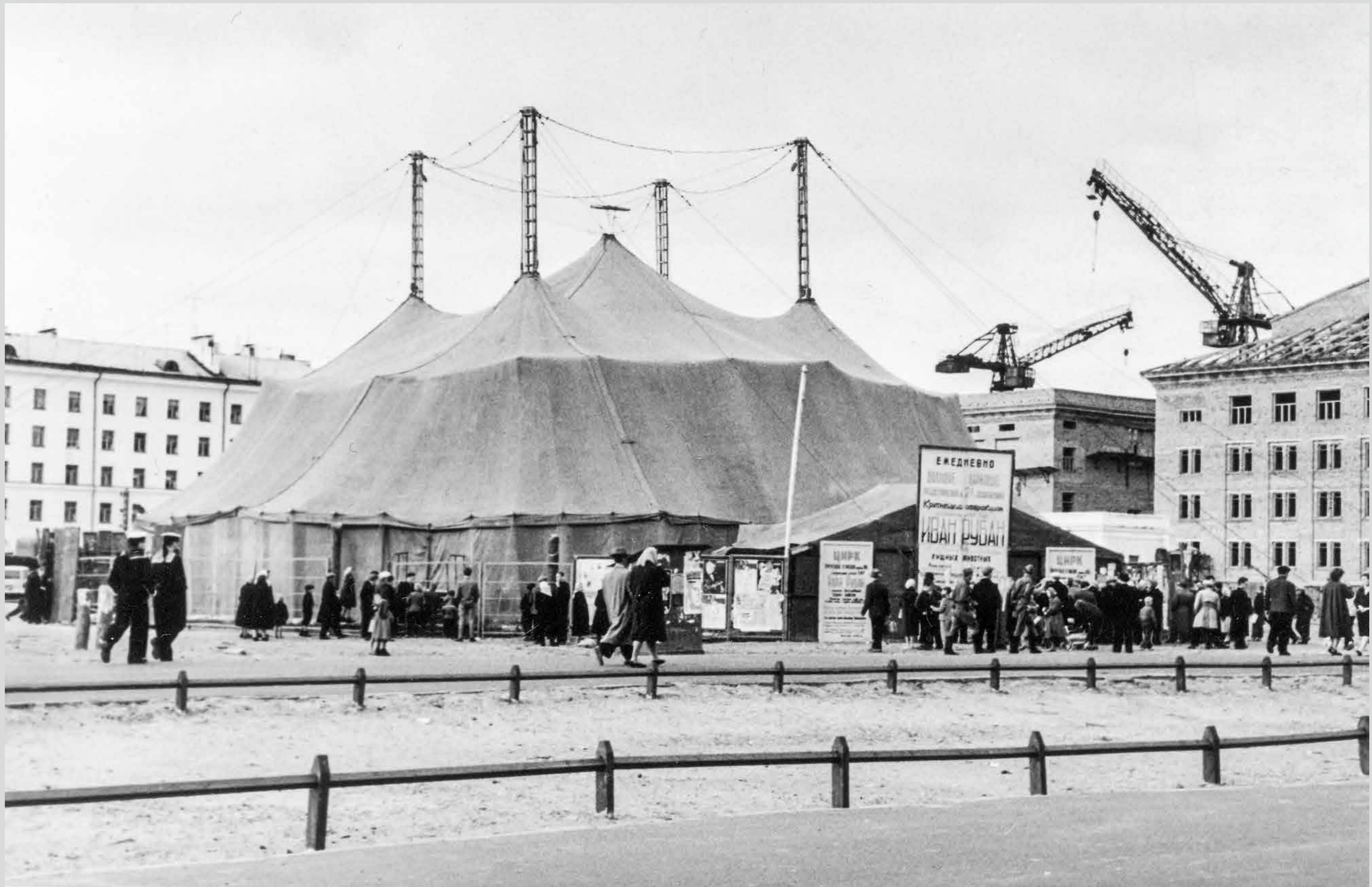
Цирк шапито в Северодвинске. 22 октября 1961 года