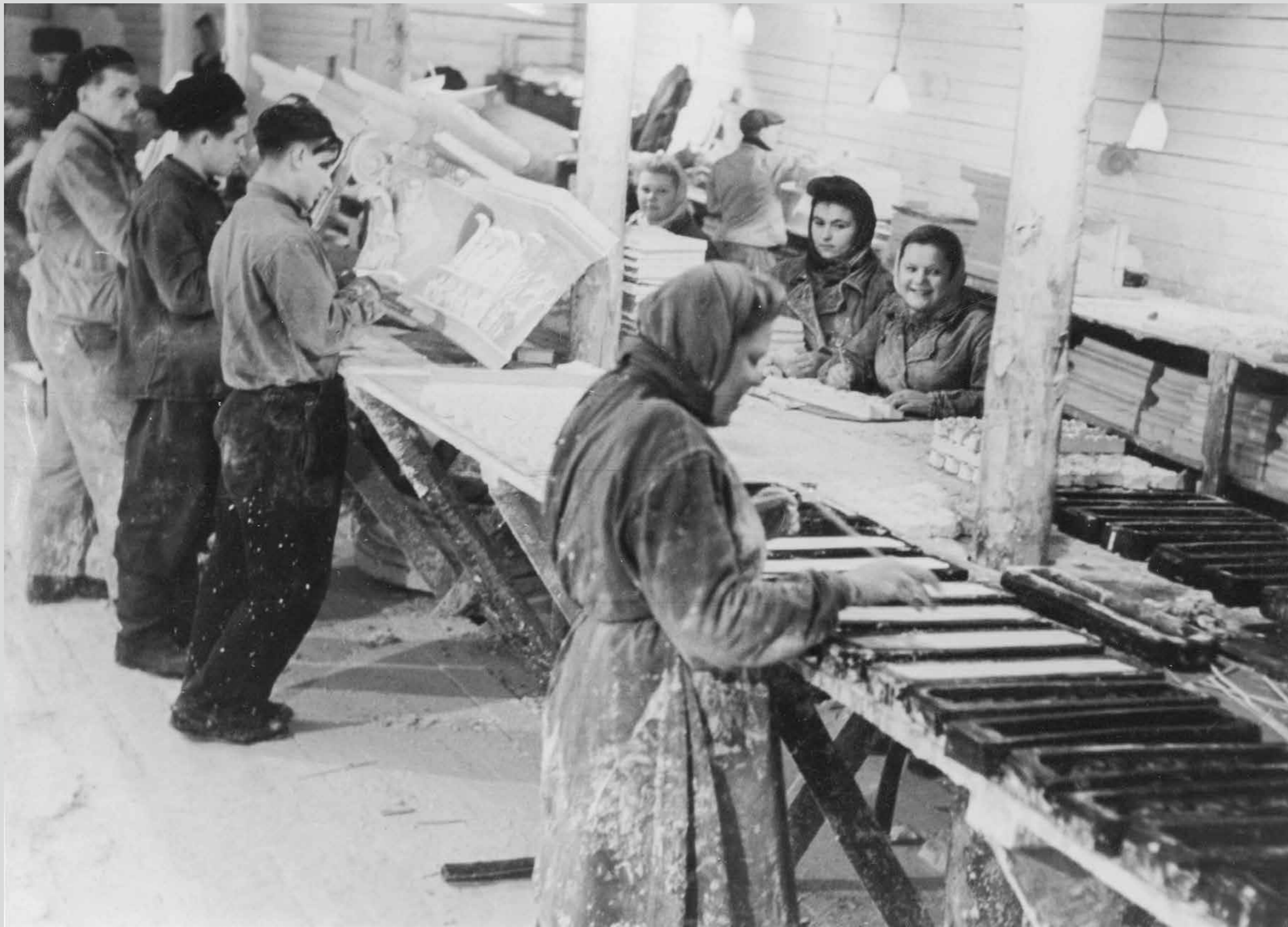
Лепная мастерская. Середина 1950- х годов