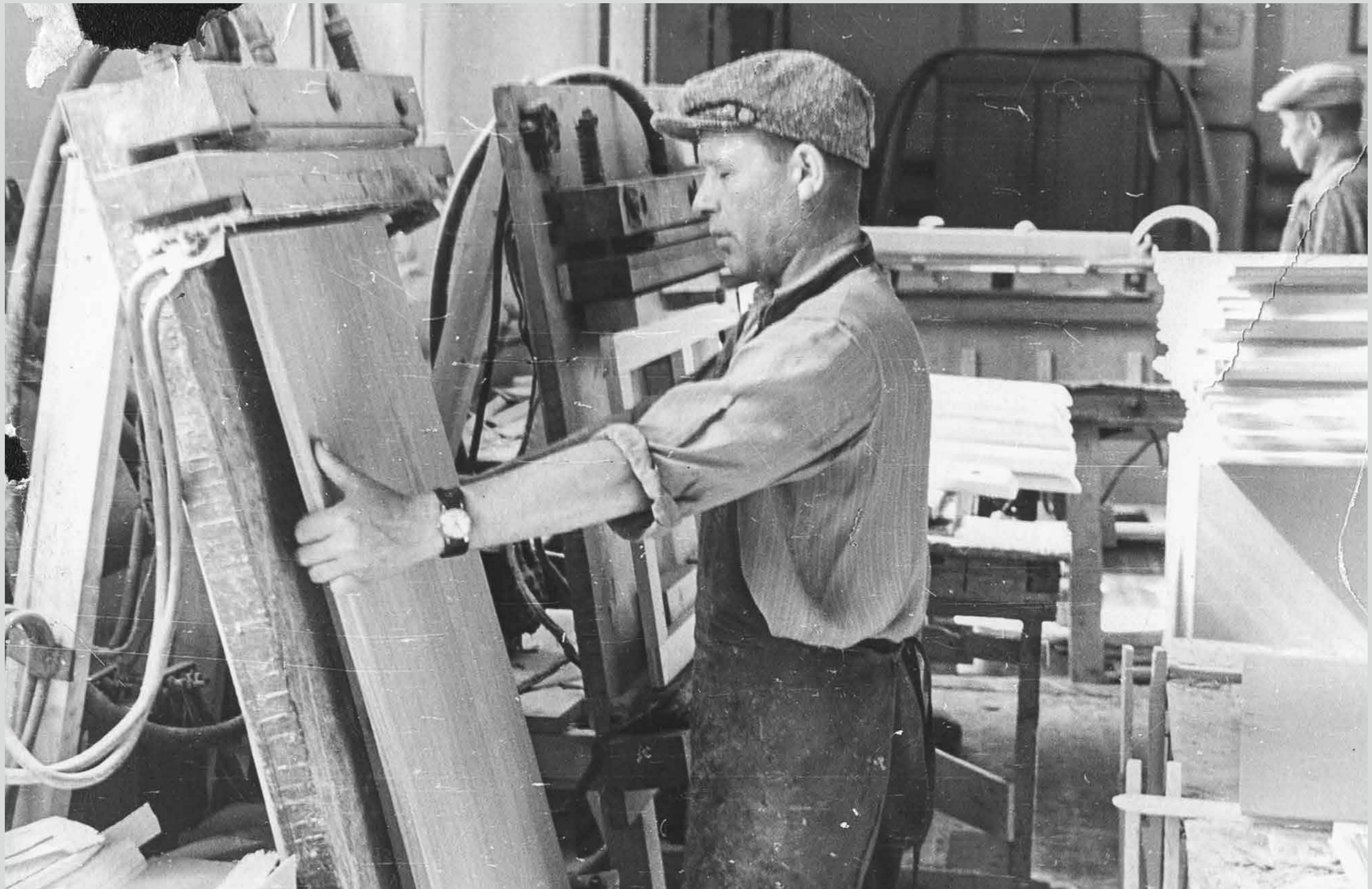
В цехе новой мебельной фабрики. Вторая половина 1950-х годов