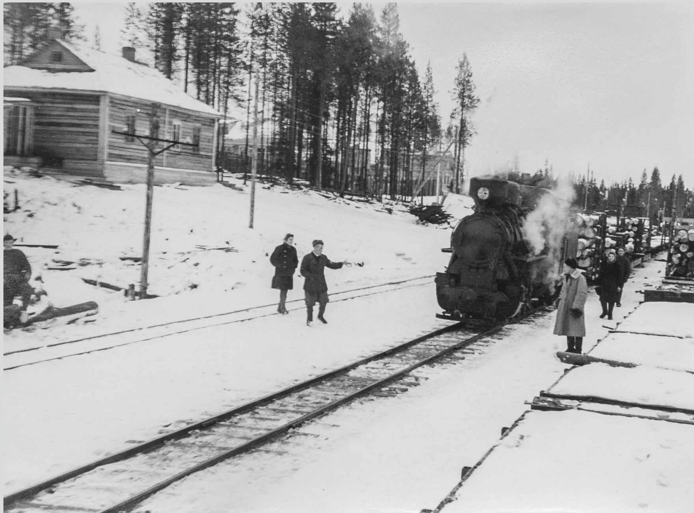
Станция «Белое озеро» Кудемской лесовозной узкоколейной железной дороги. 1950-е годы