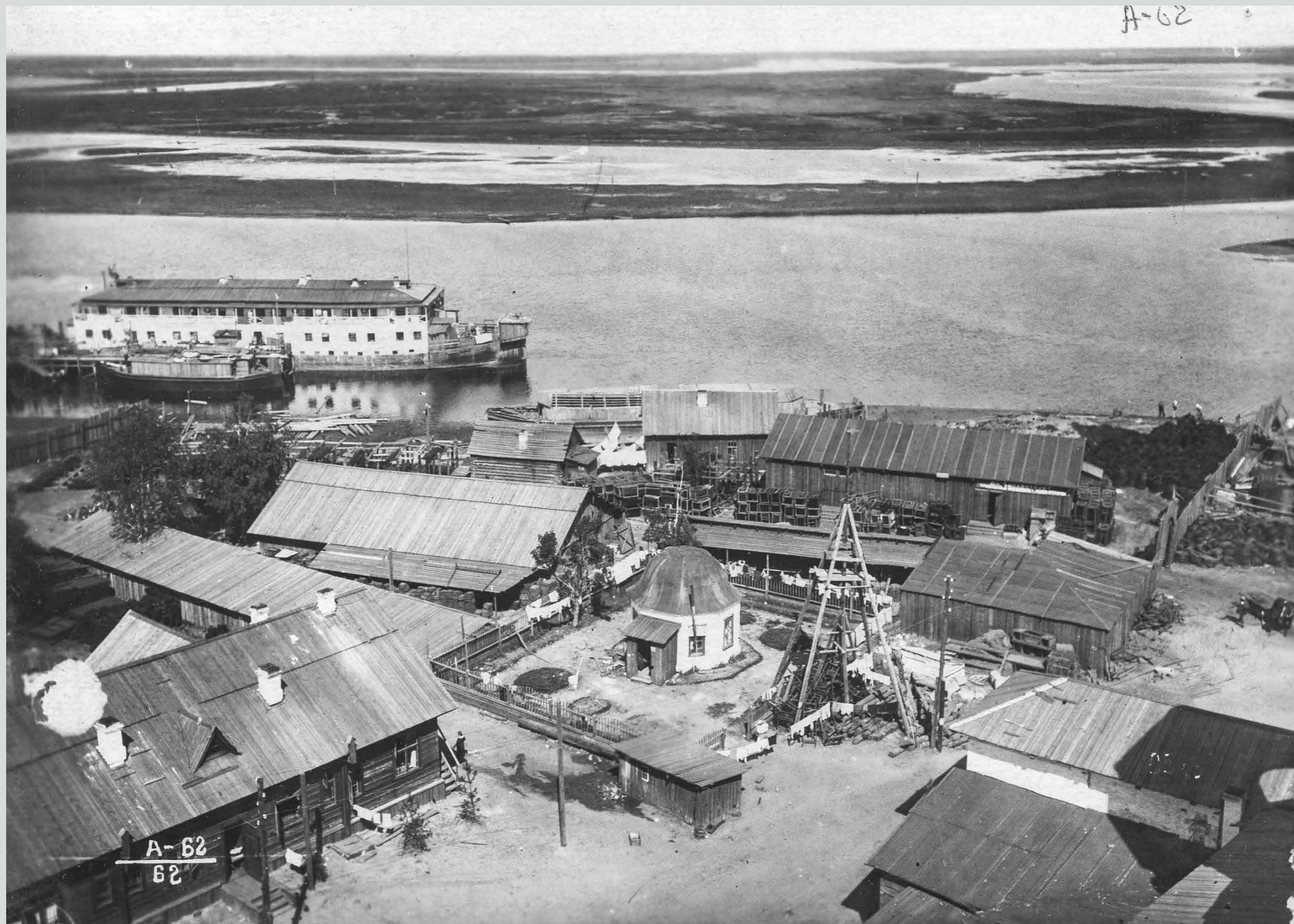
Первый участок. Вид с Николо-Корельского монастыря. 1937 год