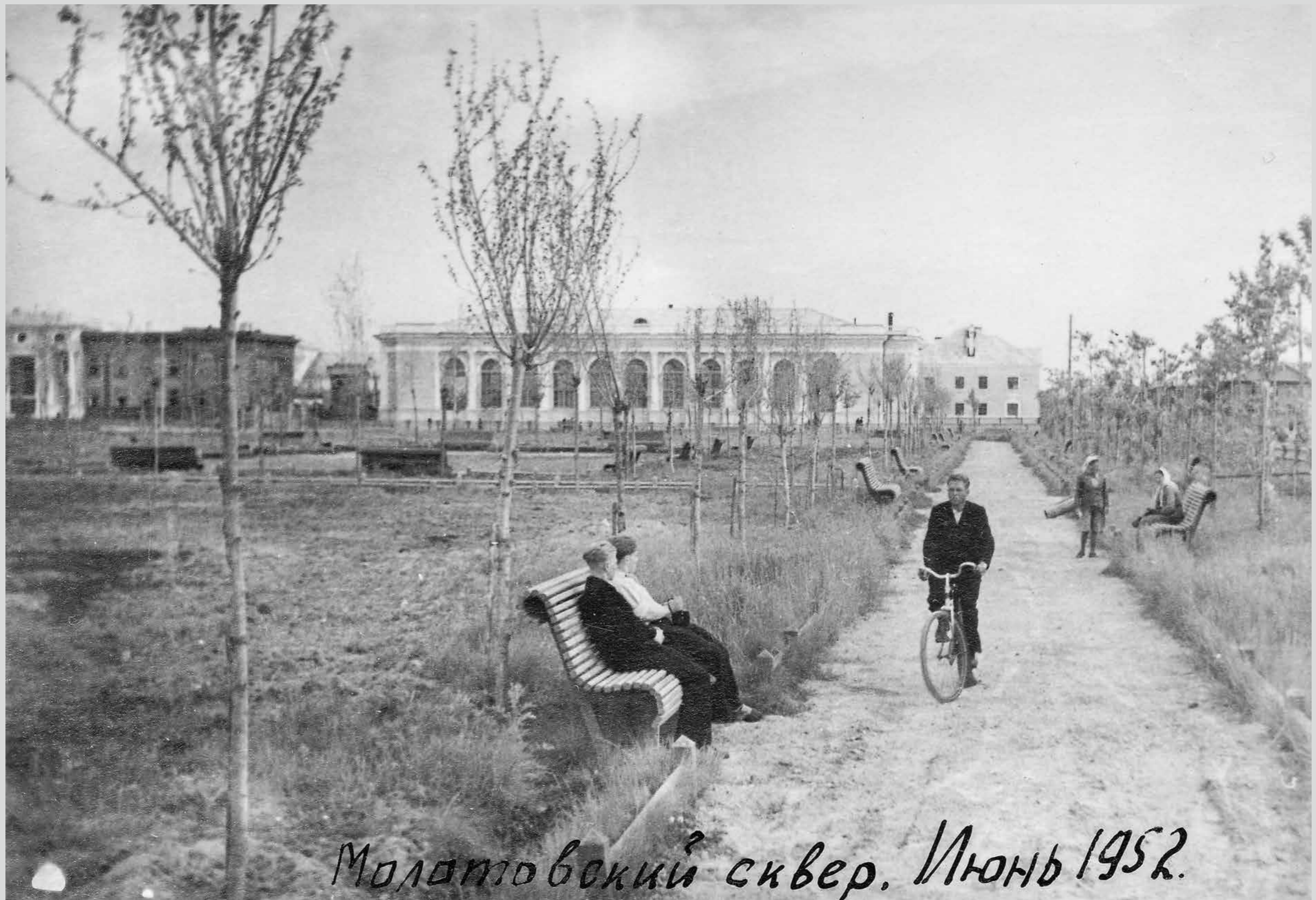
Молотовский сквер. Июнь 1952.