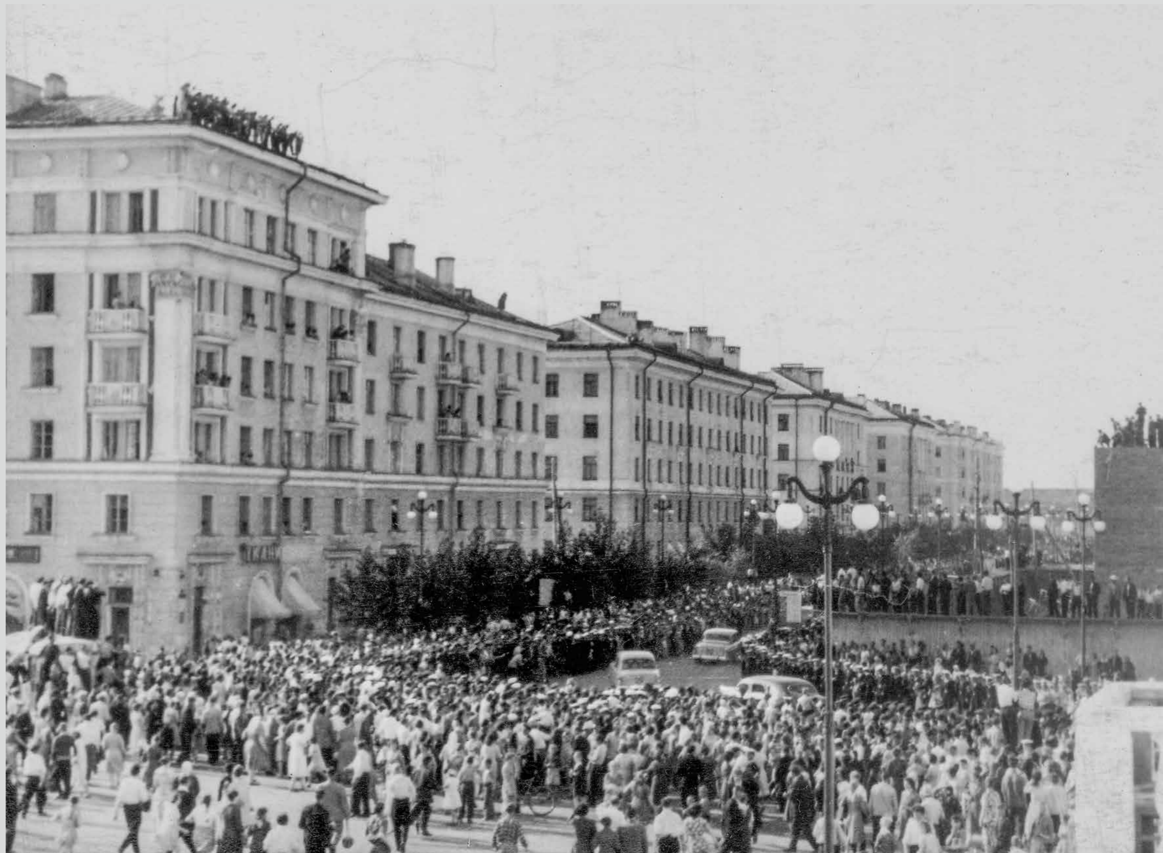
Горожане встречают Н.С.Хрущева, Первого секретаря ЦК КПСС, Председателя Совета Министров СССР. 22 июля 1962