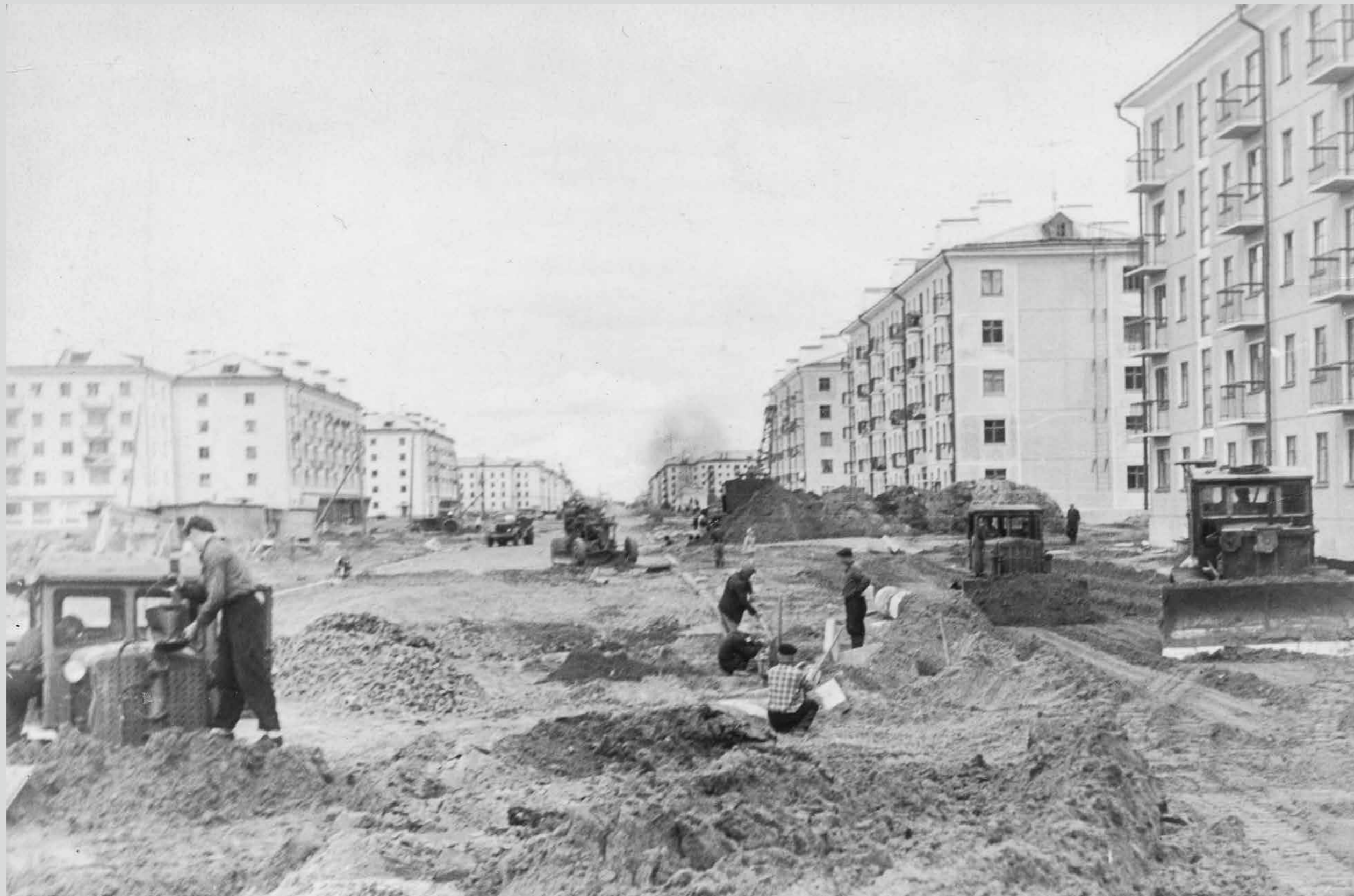
Благоустройство ул. Ломоносова. Начало 1960-х годов