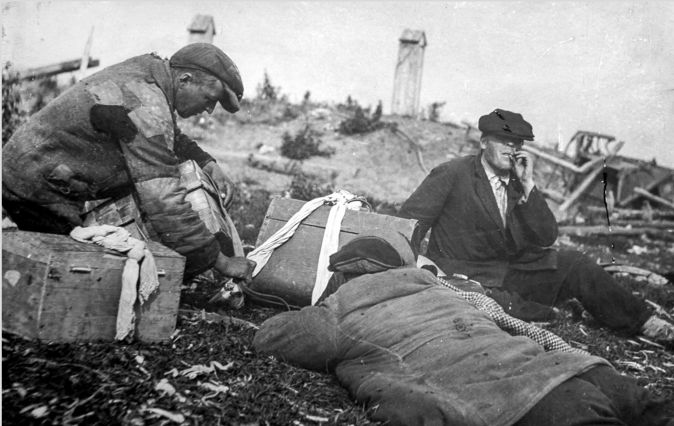
Первостроители. Лето 1936 года